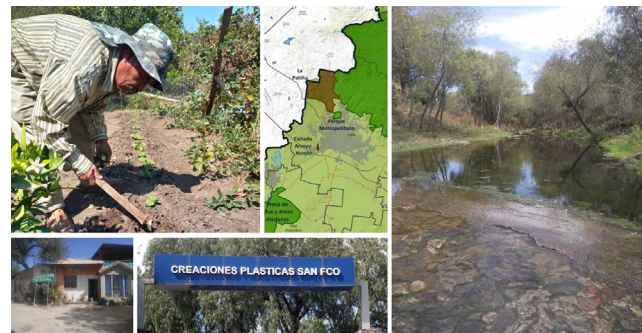
Figura 2. Descripción del paisaje y actividades de la comunidad de La Patiña

La actividad económica local de La Patiña se caracteriza por los servicios de un comercio establecido y por la salida de mano de obra —que sirve en tareas de mantenimiento y jardinería— en colonias aledañas de nivel socioeconómico alto. Así es como en esta comunidad identificamos un modo de vida vinculado más con las actividades urbanas-comerciales que con los sistemas agroecológicos tradicionales como el sistema de milpa (figura 2).