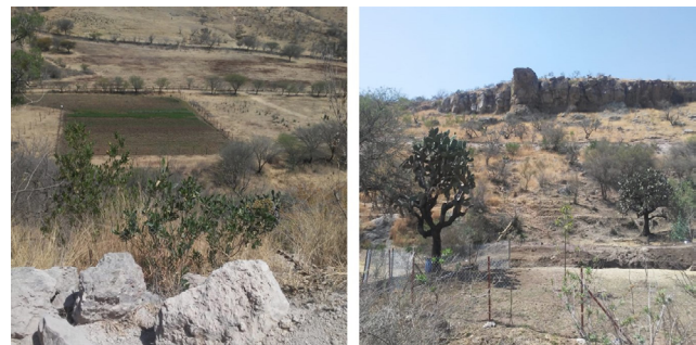
Figura 3. Descripción del paisaje de la comunidad de La Angostura

Las familias de La Angostura trabajan en tierras accidentadas de un ecosistema de selva baja caducifolia (figura 3), donde la apropiación de los recursos naturales va desde el conocimiento del tipo de tierra para sembrar hasta reconocer la vegetación del monte que incluye plantas medicinales y algunos tubérculos para comer.