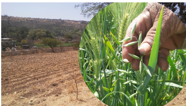
Figura 4. Sistema agrícola en laderas y cultivos de grano