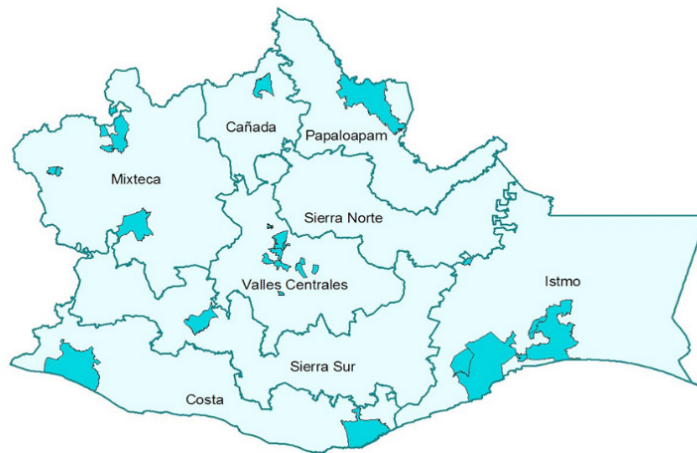
Figura 1. Ubicación geográfica por región de los municipios con portal de Internet

De acuerdo con los datos de la presente investigación se tiene que el número de portales de Internet en el estado de Oaxaca, hasta el primero de diciembre del 2017 y vigentes al momento de la evaluación en el mes de abril de 2018, fue de 23 de un total de 570 municipios, es decir, sólo el 4%. Su distribución territorial se muestra en la figura 1.