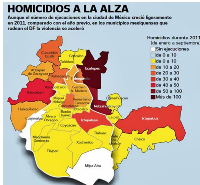
Cuadro 2. Número de Homicidios

cabo un seguimiento somero de la llamada nota policiaca de los diarios capitalinos, para darse cuenta que el tema de la seguridad en el Distrito Federal dista de ser lo óptimo que nuestras autoridades aducen.