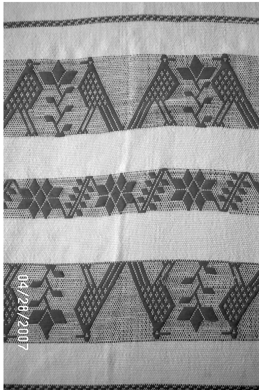
Figura 1. Diseño de una tela otomí, de Ixmiquilpan, Hidalgo.

Ahora vamos a investigar el proceso de bordar. En la figura 1 aparecen varias copias de la forma de un pájaro.