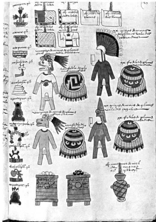
Figura 5. Lámina del Códice Mendocino . En la parte izquierda se muestran los glifos de Mixquiahuala y Ixmiquilpan. Imagen de Codex Mendoza (1978), comentarios de Kurt Ross, figura (F), p. 46.

Atotonilco de Tula, Acoluhuacan y Xillotepec (Jilotepec), zonas en donde había otomíes (véase Lastra 2006, mapas 2 y 3). En la figura 5 (tomada del trabajo de Ross 1978) se ven unos glifos cuadrados que representan tributos de textiles. Por encima de cada glifo aparece un símbolo de 400. Mohar (2001: 52) nos indica que los tributos de textiles eran algo importante respecto al trabajo de las mujeres que los tejían, “El hábil manejo del telar se manifiesta en la entrega de complicados diseños...”. Así, vemos otro ejemplo de la importancia cultural de los tejidos. En la parte izquierda de la figura 5 se ven los glifos de Ixmiquilpan y Mixquiahuala. Esto implica que una porción de los tributos descritos fueron entregado por otomíes.