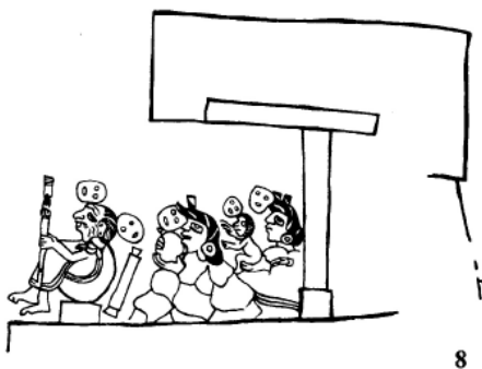
Fig. 5: El cipactli mantiene en su quijada la pierna arrancada de Xochipilli ( Códice Fejérváry-Mayer , p. 42); fig. 6: Itztlacoliuhqui, “Cuchillo curvo de obsidiana”, transgresor ebrio y dios del hielo ( Códice Borgia , p. 69); fig. 7: Mayahuel-Tzitzimil vierte su leche-pulque hacia un jarro de pulque (Taube 1997: 123); fig. 8: Máscaras de penca de maguey para protegerse durante la fiesta del Fuego Nuevo ( Códice Borbónico , p. 34).