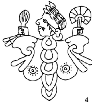
Fig. 1: Serpiente de Fuego acompañada de la glosa tlantepuzillamall ( Códice Nuttall , p. 76); fig. 2: Itzpapálotl, “Mariposa de Obsidiana”, con disfraz de águila ( Códice Borbónico , p. 15); fig. 3: Itzpapálotl como atavío de cobre de los guerreros tiyacacauan (Sahagún 1993: f. 78v); fig. 4: Itzpapálotl bajo la forma de una mariposa ( Códice de Tēpeucila )