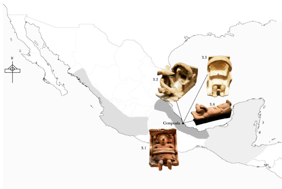
Figura 3. Figurillas del Posclásico. Imágenes, V. Tiesler.

al pequeño, para dar estabilidad y favorecer la compresión superior de la cabeza, donde el resultado que se infiere es un tipo cefálico erecto paralelepípedo. En general, las imágenes del Posclásico (las pocas con las que contamos de esa cronología) indican que nuevamente se utilizaron los dispositivos corporales con una variedad de aditamentos. Típicamente se reconocieron posibles formas erectas, también en la costa del Golfo (figura 3).