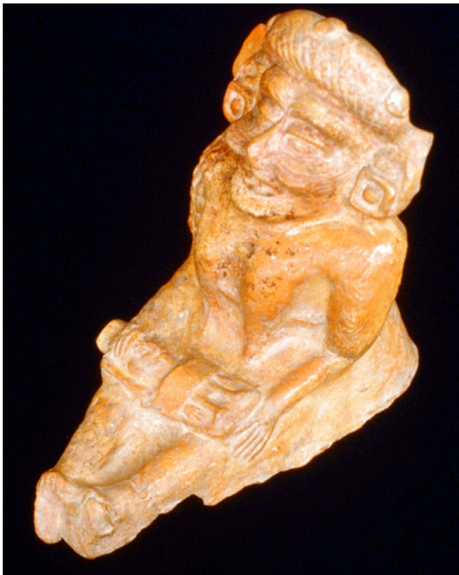
Figura 5. Imagen de mujer senil e infante.

En primera instancia, se perciben en el registro como dispositivos que pueden tener diferentes funciones en el cuidado y protección integral, en el sentido que atienden aspectos físico-anímicos. Como dispositivos de la práctica, variaba su grado de compresión, así como las formas cefálicas que se lograban entre los infantes, puesto que presentaron múltiples aditamentos y características particulares, lo que concuerda con una mayor necesidad de mantener la estabilidad y la presión necesarias inherentes al proceso de modelado en comparación con los implementos libres.