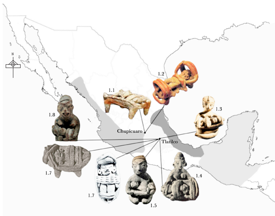
Figura 1. Figurillas del Preclásico. Imágenes obtenidas de: (1.1) Portafolio Justin Kerr (K6915); (1.2) Arqueología Mexicana 10 (60); (1.3, 1.4, 1.5, 1.6, 1.7 y 1.8) Romano (1974).

Las cunas se elaboraron con varas e incluyen mayores aditamentos blandos. En éstas, los infantes están sujetos a la altura del tórax y las rodillas mediante bandas. Otras tiras presionan la cabeza, desde el frontal y mantienen el occipucio sobre la cuna (en los casos vistos, los niños se presentan boca arriba); eran ge-