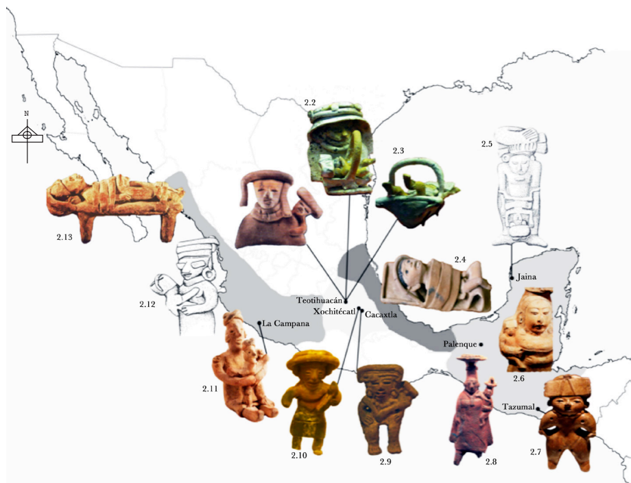
Figura 2. Figurillas del Clásico. Imágenes obtenidas de: (2.1) Colección Stavenhagen (2011); (2.2, 2.3, 2.6, 2.9 y 2.10) fotografía, V. Tiesler; (2.4 y 2.13) fotografía, A. Romano; (2.5) Winning (1968); (2.7) fotografía, S. Suzuki; (2.8) Arqueología Mexicana 10 (60); (2.11) Jarquín y Martínez (2012); (2.12) Pereira (1999).

la muestra que presentan a personajes de diversas edades usándolos. El análisis clasificatorio de las representaciones de esos aparatos por áreas y culturas permite vincular este rasgo con ornamentos distintivos de grupos regionales o étnicos y no precisamente al intento de moldear la cabeza; así, se abre la posibilidad de que los casos mencionados también tuvieran la misma connotación para los niños.