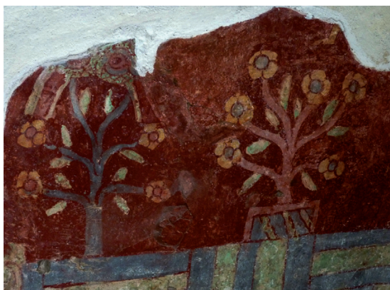
Figura 2. Pintura del muro sur del edificio principal del tlapatini de Tepantitla con representaciones de plantas medicinales.