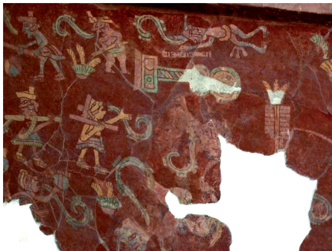
Figura 3. Representación de un Tlalocan o espacio del inframundo, pero referido a la clase social dominante de Teotihuacan. Nótese que además de las vestimentas y tocados, también está representado un jugador obeso y otro con deformación en los pies.

En cambio, en el sector sur del mismo mural se representan personajes mejor ataviados que de manera colectiva realizan distintos juegos, como pegarle a la pelota con un palo en una cancha limitada por estructuras y marcadores. Como si de alguna manera el acceso al inframundo fuera diferencial según los diferentes sectores sociales (figura 3).