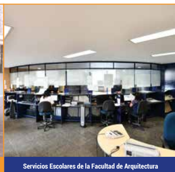
Servicios Escolares de la Facultad de Arquitectura