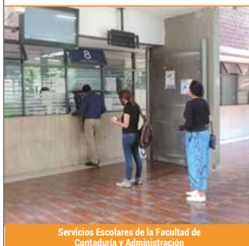
Servicios Escolares de la Facultad de Contaduría y Administración