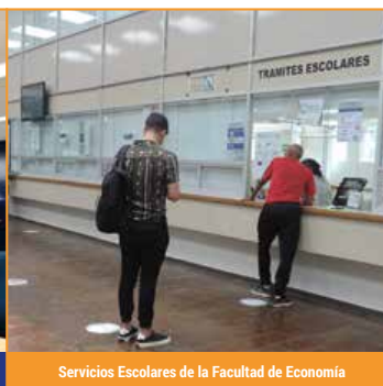
Servicios Escolares de la Facultad de Economía