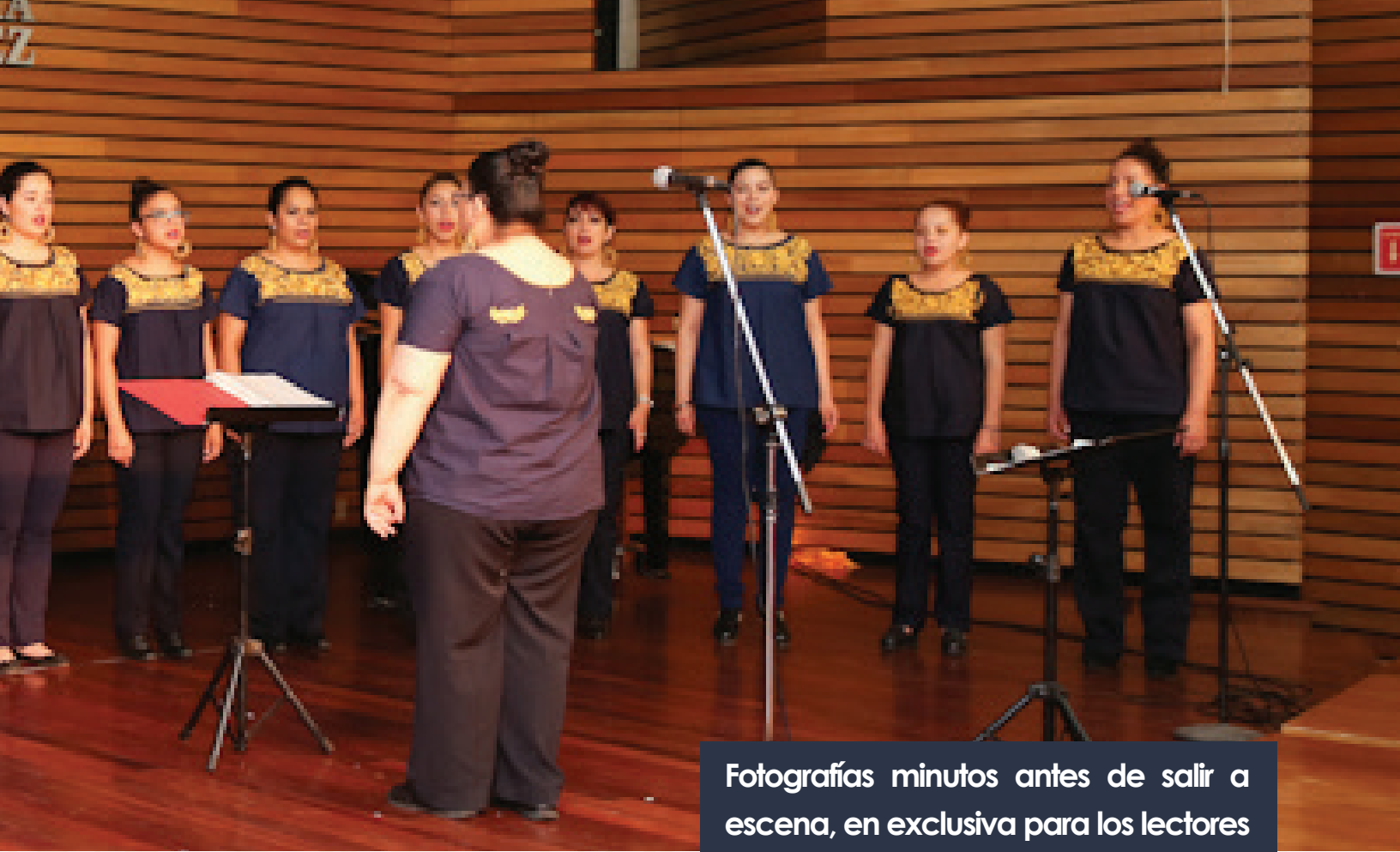
Fotografías minutos antes de salir a escena, en exclusiva para los lectores del Búho Gaceta Electrónica de la Facultad de Derecho.