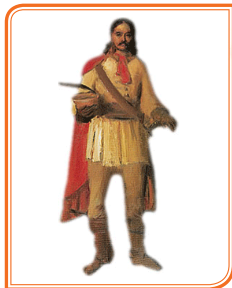
La corbata croata hravatska

Con el paso del tiempo la prenda se ha ganado un lugar en la indumentaria masculina