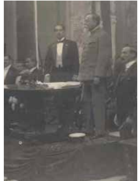
Congreso constituyente de 1917

11.1 22/octubre/1916. Se celebraron las elecciones para diputados al Congreso Constituyente, el cual se dedicó a elaborar la actual Constitución en el estado de Querétaro.