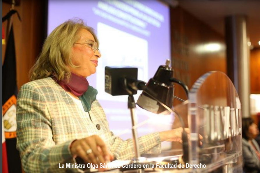
La Ministra Olga Sánchez Cordero en la Facultad de Derecho

Con la Cátedra Magistral “Caso Florence Cassez” impartida por la Doctora Olga Sánchez Cordero de García Villegas, Ministra de la Suprema Corte de Justicia de la Nación, arrancaron los cursos 2014-1 de la Facultad de Derecho de la Universidad Nacional Autónoma de México.