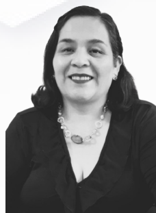
Por Liliana Gonzalez