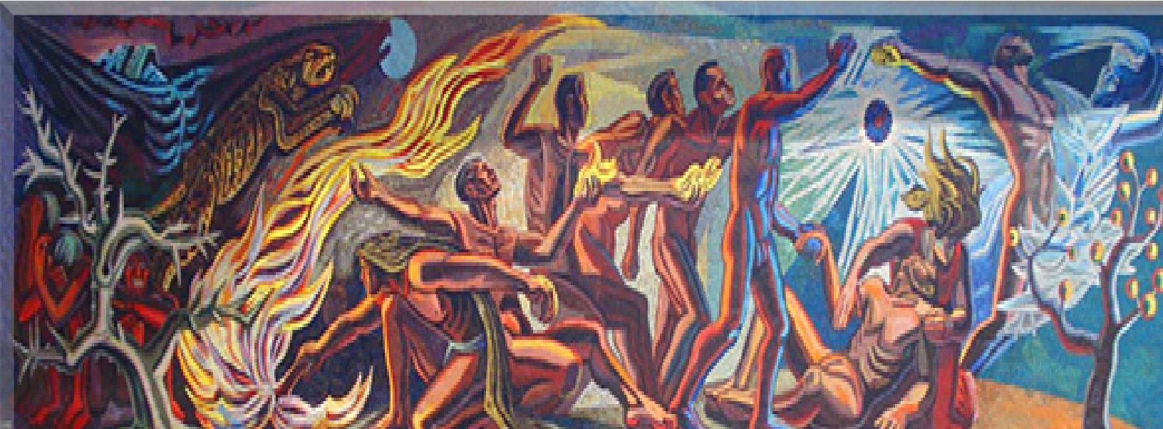
"La conquista de la energía". José Chávez Morado, 1952. Auditorio Alfonso Caso.

La revista de Enfermería CuidArte es una publicación semestral de la comunidad académica de la carrera de Enfermería de la Facultad de Estudios Superiores Iztacala (FESI) de la Universidad Nacional Autónoma de México (UNAM), que sirve para difundir en Español y en otros idiomas, los avances metodológicos, teóricos, de investigación empírica, técnicas, procedimientos y avances disciplinarios en general entre los miembros de la comunidad académica y científica mundial de la disciplina.