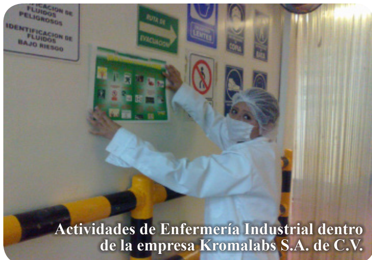
Actividades de Enfermería Industrial dentro de la empresa Kromalabs S.A. de C.V.