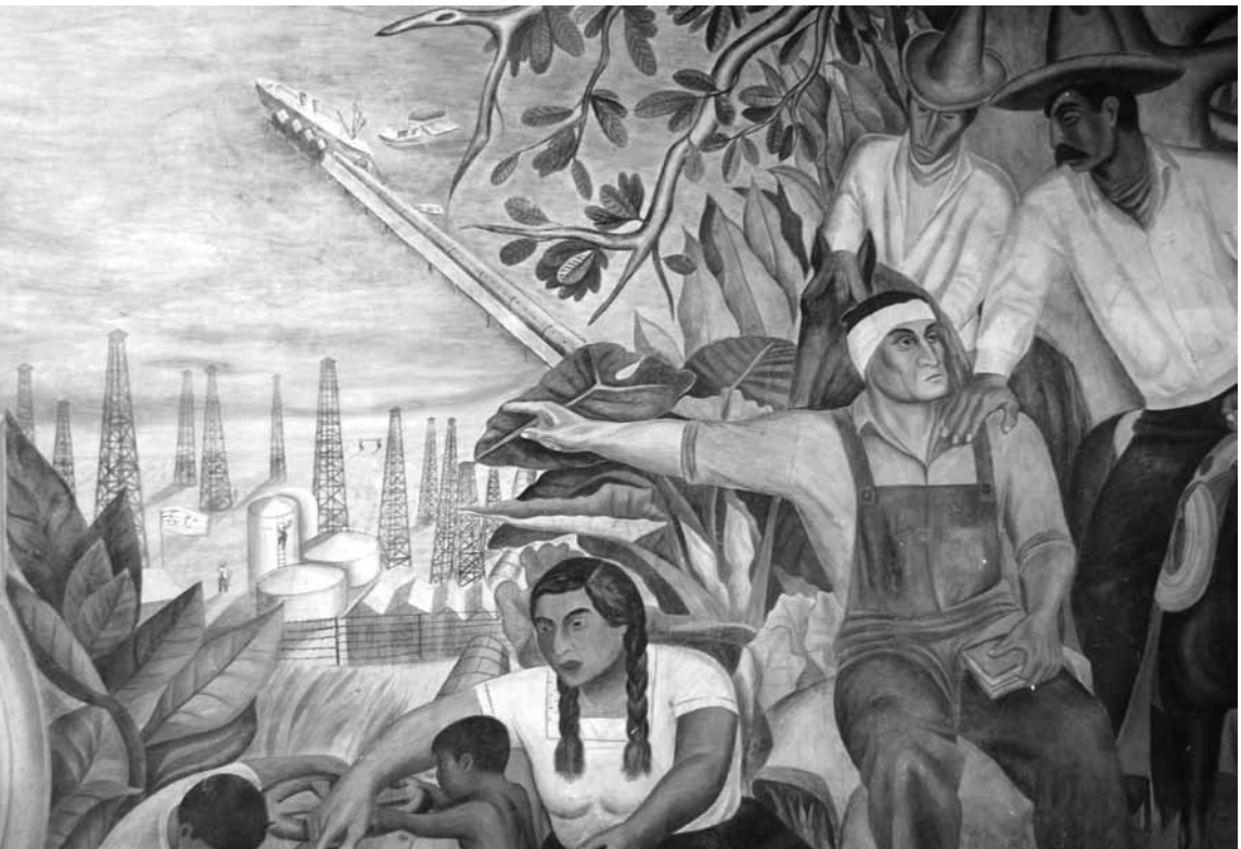
Detalle con paisaje tropical y personas del campo, con un obrero que señala la invasión de 1914. En la parte inferior una mujer indígena con sus hijos.