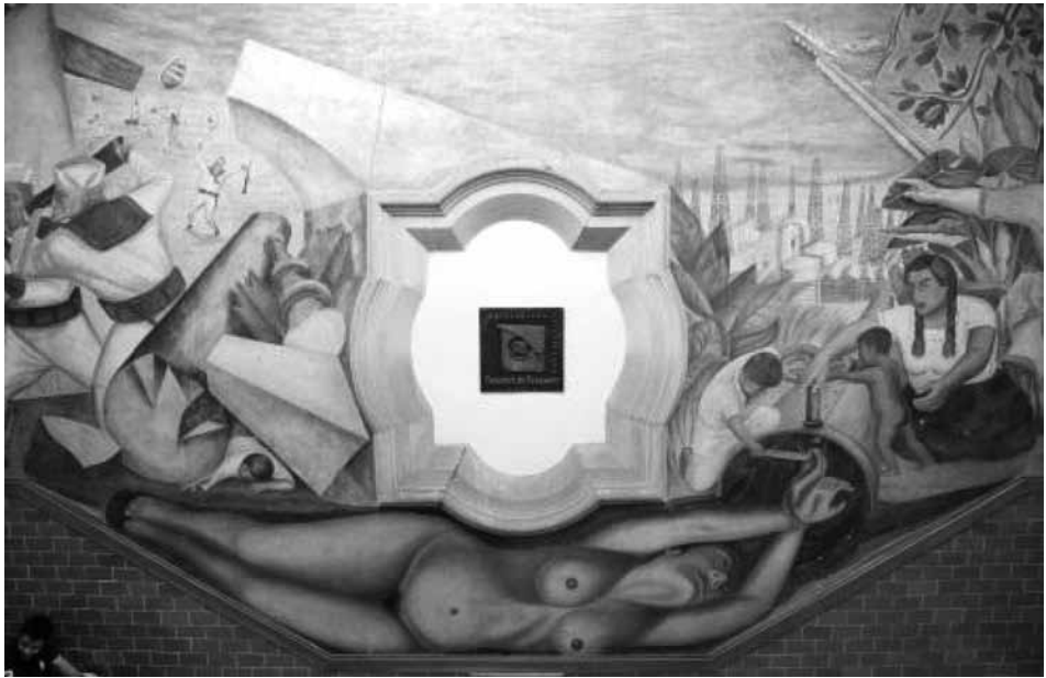
Vista general del mural La lucha antiimperialista en Veracruz pintado al fresco por José Chávez Morado en el cubo de la escalera.