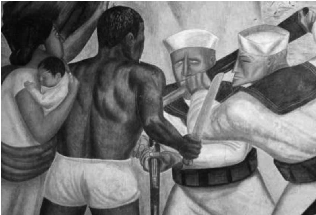
Detalle del mural La lucha antiimperialista en Veracruz que representa el enfrentamiento de las tropas estadounidenses con el pueblo de Veracruz, ilustrando el ataque histórico de 1914.