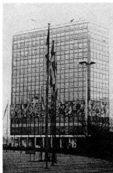
Haus des Lehrers, vista general.

Hermann Henselmann, jefe del colectivo más importante de arquitectos en la DDR y diseñador de la casa de los maestros, 5 en su propia biografía expresó las contradicciones de obedecer a una estricta, pero no siempre bien justificable, determinación ideológica de las formas arquitectónicas por el partido de unidad so-