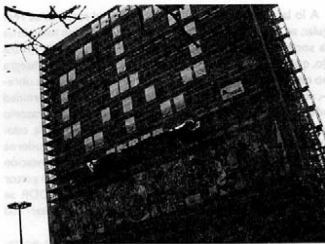
Haus des Lehrers, Berlin- Blinkenlights-Peace.

cuelas públicas. Pero, ya en 1994 empezó la desideologización, respectivamente reideologización del edificio según los estándares políticos de Alemania reunificada; rentaron oficinas e intentaron, sin éxito, vender todo el conjunto. Finalmente en 2001 lograron vender el edificio lateral a la torre, el centro de congresos y la Haus des Lehrers misma, se pusieron bajo la custodia de una empresa semiestatal.