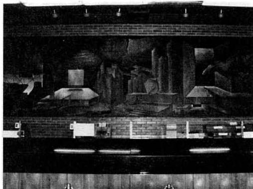
Carlos Colombino, 1982, xilopintura.

Paraguayo Americano. En la Bial de San Pablo de 1957 obtuvo conjuntamente con Josefina Plá el Premio Arno. En la IX Bial se le concede el honor de la Sala Especial.