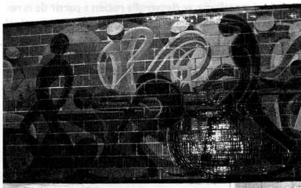
Josefina Plá y José Laterza Parodi, 1962, cerámica.