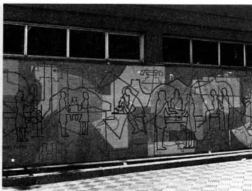
José Laterza Parodi, 1967, cerámica.