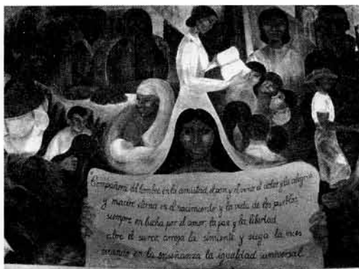
Olga Blinder, 1957, encáustica.