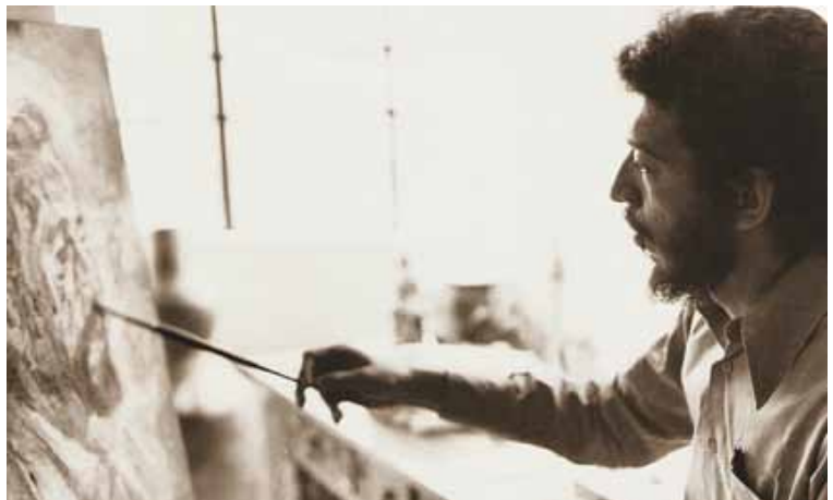
El maestro en su estudio.