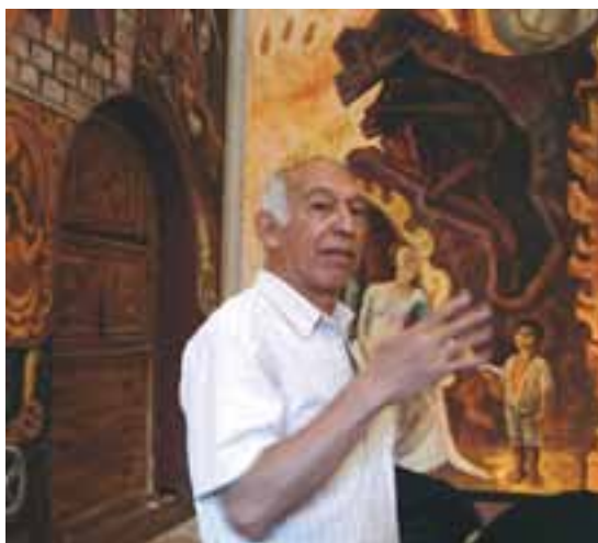
Curso de Pintura mural al fresco. Agosto - Septiembre 2008. Guanajuato, Guanajuato.