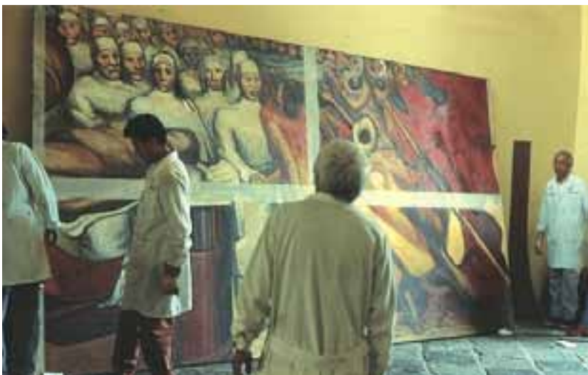
Restauración del mural Apología de la futura victoria de la ciencia médica sobre el cáncer de David Alfaro Siqueiros.