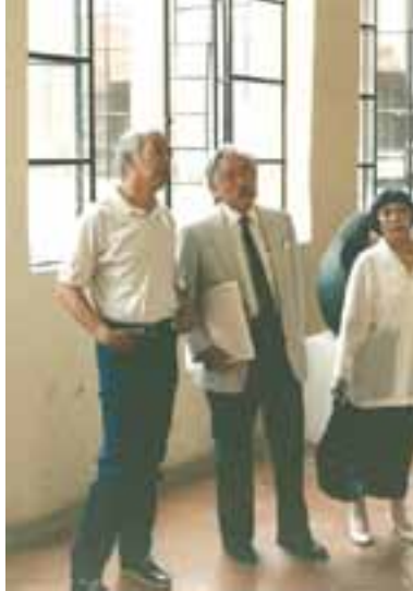
Con el pintor Luis Nishizawa en el Centro Nacional de Conservación del INBA, supervisando el estado de sus murales rescatados después del sismo.