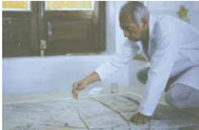
Trabajando sobre el mural del pintor José Clemente Orozco, en Orizaba, Veracruz.