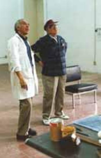
Con el pintor Raúl Anguiano mientras pintaba un mural para la Secretaría de Educación Pública.