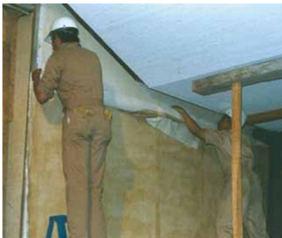
Desprendimiento de un mural del pintor Luis Nishizawa.