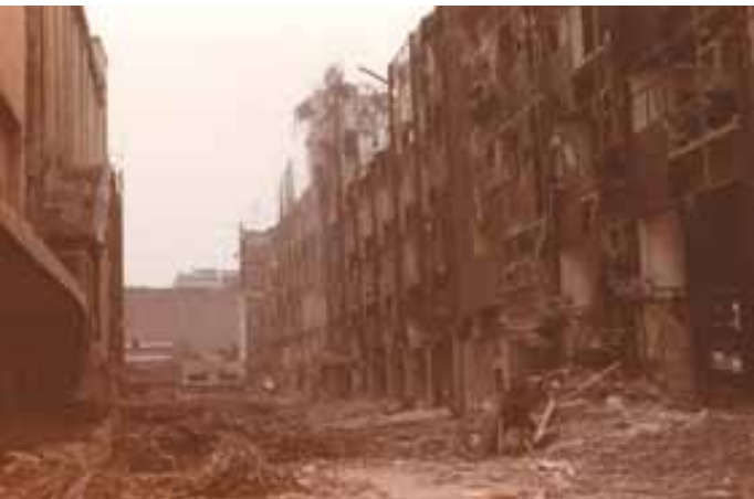
Rescate del patrimonio muralístico en la ciudad de México, Terremoto de 1985.