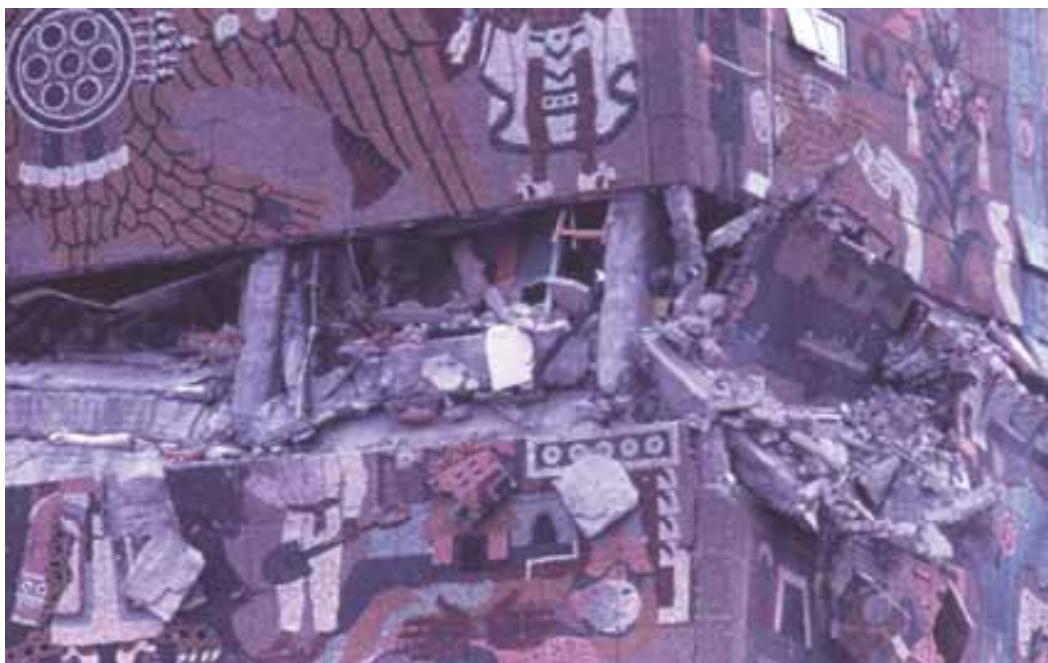
Rescate del patrimonio muralístico en la ciudad de México, Terremoto de 1985.