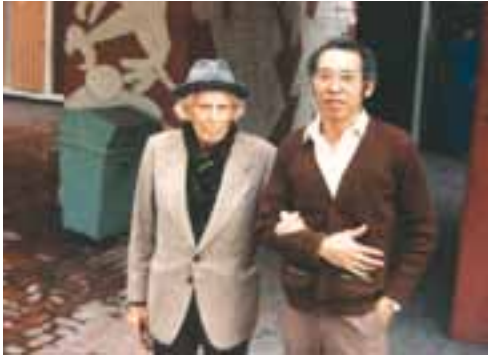
Con el pintor Carlos Mérida visitando su obra mural en el Multifamiliar Benito Juárez, perdida en el terremoto de 1985.