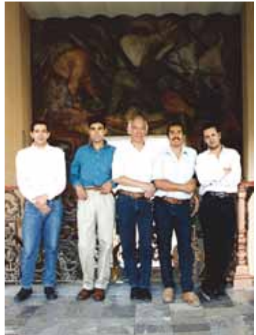
Con su equipo de restauradores en el proyecto de restauración del mural Reconstrucción o Revolución social del pintor José Clemente Orozco en el Palacio Municipal de Orizaba, Veracruz, 1996.