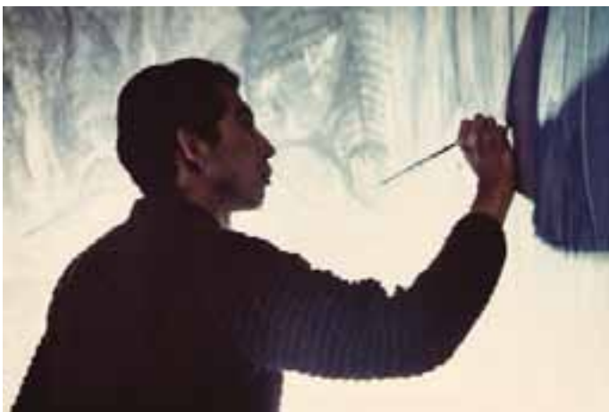
Restauración de murales de Diego Rivera, Secretaría de Educación Pública, México, D. F., 1965.