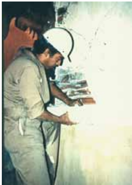
Desprendimiento de un mural del pintor Luis Nishizawa afectado por el sismo de 1985, México, D. F.