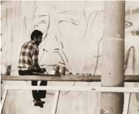
Ejecución de mural al fresco: "La Expropiación petrolera", Palacio Municipal de Yurécuaro, Mich., 1971.

Fue el decano de dicha área y colaboró en todos los trabajos de conservación de pintura mural del siglo xx realizados por la dependencia. Ha dirigido las únicas intervenciones internacionales en el campo efectuadas por el INBA: el mural de Diego Rivera en el Museo de Arte Moderno de New York y el fresco de Pablo O'Higgins en la International Longshore and Warehouse Union (ILWU), en Oahu, Hawai. Actualmente, colabora en la Escuela de Conservación y Restauración de Occidente en Guadalajara, Jalisco, así como en la Universidad de Guadalajara.