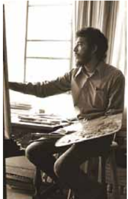
Pintando en su estudio.