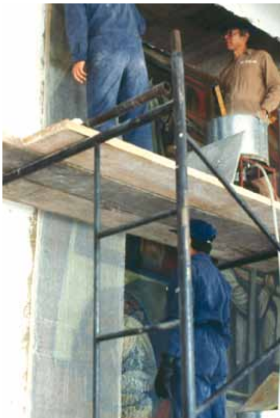
Procesos de desprendimiento del mural del pintor Alfredo Zalce en el Edificio de la Secretaría de Industria y Comercio, 1986.