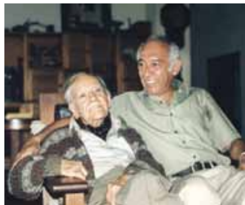
Con el pintor Alfredo Zalce en su casa de Morelia, Michoacán.