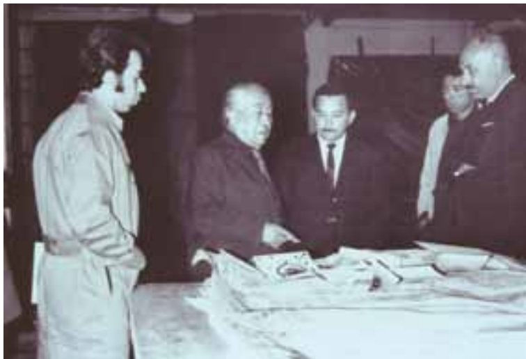
Con el pintor Xavier Guerrero, 1965.

Es miembro del proyecto El muralismo, producto de la revolución mexicana, en América, que se desarrolla en el Instituto de Investigaciones Estéticas y que publica la revista Crónicas , en cuya sección "Los secretos desde el muro", regularmente escribe sobre los hallazgos técnicos y los procesos de restauración de las obras de artistas del movimiento muralista mexicano del siglo xx.