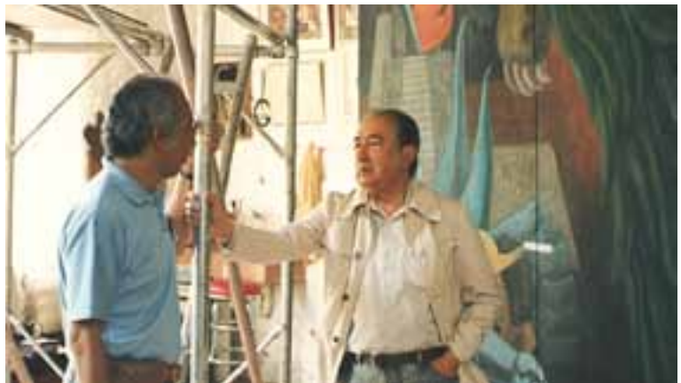
Con el pintor guanajuatense José Chávez Morado en su casa de Pastita. Hoy Museo Oiga Costa y José Chávez Morado.