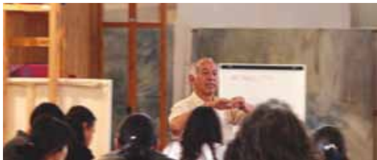
Curso de Pintura mural al fresco. Agosto - Septiembre 2008. Guanajuato, Guanajuato.