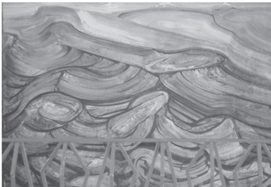
Paisaje de Copiapó, 1972.

La significación que tuvo la inauguración de un conjunto habitacional para trabajadores como el que nos ocupa, creo que tiene mucho que ver con el pensamiento de Siqueiros expresado en Los vehículos de la pintura dialéctico-subversivo , resumido así por Raquel Tibol: " El trabajo de grupo reconcentra enorme riqueza emotiva, técnica y de acción física humana sobre la tarea emprendida. El trabajo colectivo es la forma orgánica correspondiente a la pintura monumental. Es la máquina necesaria para la consecución de la obra 'grande del cuerpo y alma'. 25