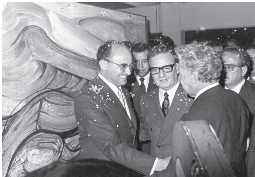
Siqueiros y los presidentes Luis Echeverría Álvarez y Salvador Allende durante la inauguración del mural, el 2 de diciembre de 1972.

cia que recordaría en una entrevista durante la inauguración del mural Copiapó, al referirse al país andino y a la región de Atacama: "la conozco porque estuve allí cuatro años, después de que salí de la cárcel en México en 1940". 7