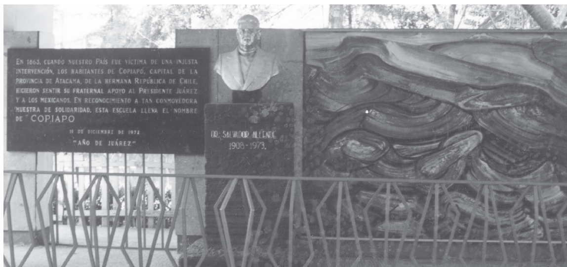
Vista general. Placa conmemorativa, busto de Salvador Allende y Paisaje de Copiapó .

miento poblacional de la ciudad exigía también la proliferación de servicios (bancos, comercios, deportivos, centros culturales y de entretenimiento) para el gobierno e implicaba enfrentar grandes desafíos: "asentamientos humanos incontrolados, invasión de tierras, proliferación de ciudades perdidas, abigarramiento en zonas perdidas, edificios de vecindad y fraccionamientos clandestinos lotificados al margen de la ley que especulan con la pobreza, buena fe e ignorancia de las gentes", 14 además de promover campañas para el control de natalidad, tuvo que impulsar planes de vivienda popular para "los grupos más modestos que se afanan por alcanzar un mejor nivel de vida". 15