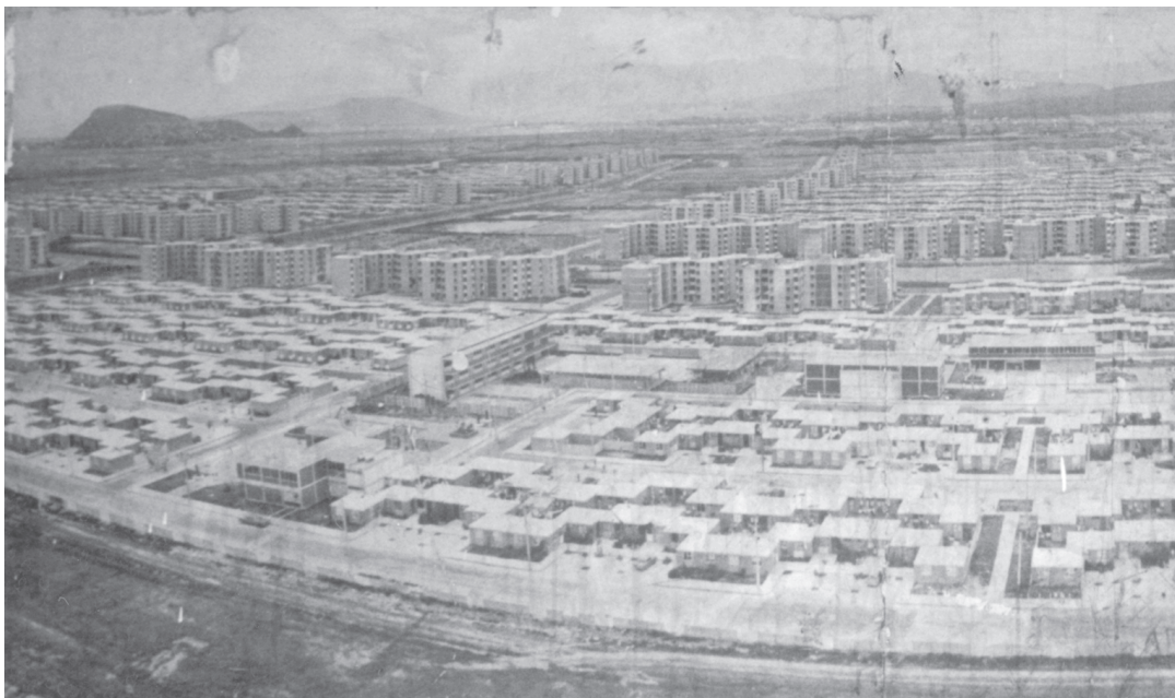
Vista general de la Unidad Habitacional Vicente Guerrero, ca. 1972. Reprografía tomada en las oficinas administrativas de la UHVG. Fondo SIMMA/LLO.

en muchos sentidos pero, más aún por su última y más larga estancia en la prisión citadina de Lecumberri conocida como el "Palacio Negro", donde paso un encarcelamiento de casi cuatro años que minó su estado de salud; confinado ahí en 1960 por el presidente de México Adolfo López Mateos, concediéndole el indulto en 1964, para a partir de ese momento abocarse a terminar algunos proyectos inconclusos, pero sobre todo concentrar sus esfuerzos en crear el Polyforum Cultural su "obra magna que culmina todos los experimentos ... en sus creaciones