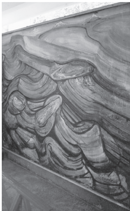
Paisaje de Copiapó .

Siqueiros realiza Paisaje de Copiapó en piroxilina sobre masonite, cuyas medidas son 2.74 \times 1.95 \text{ m}^2 . Se localiza en el vestíbulo de la escuela primaria sobre un murete. Del lado izquierdo de la obra se ubica una placa conmemorativa con una inscripción que alude al momento histórico juarista. Y al centro está un busto del presidente Allende. El conjunto está protegido por un techo de loza ligera. 23 Por estar casi a la intemperie el soporte muestra humedad y la superficie pictórica polvo y rastros también de humedad, al igual que "telarañas asentadas en los bordes perimetrales ... otras afectaciones son los rayones