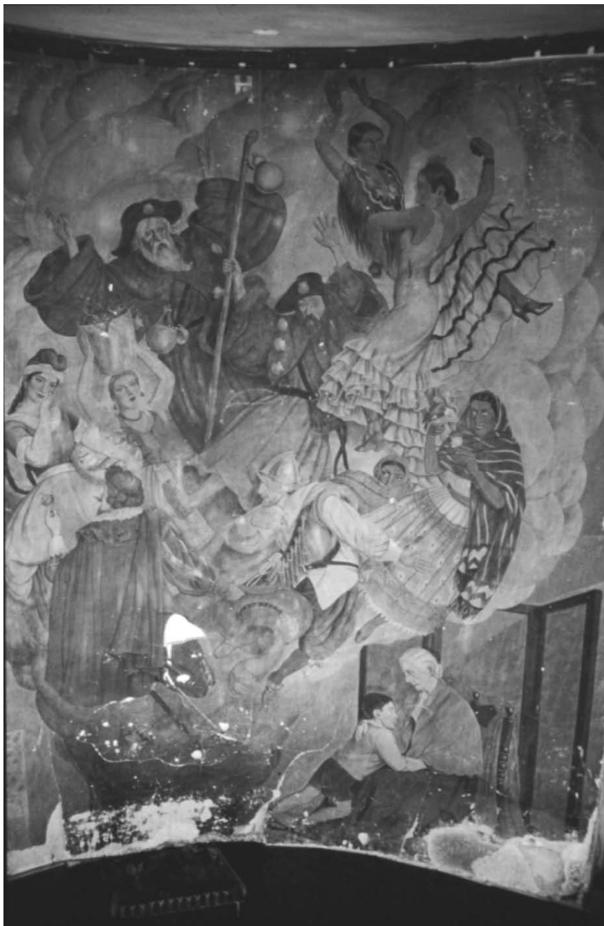
Fernando Leal. Fantasmagorías. Casa particular, México, D.F. Fresco sobre muro directo, 1941.