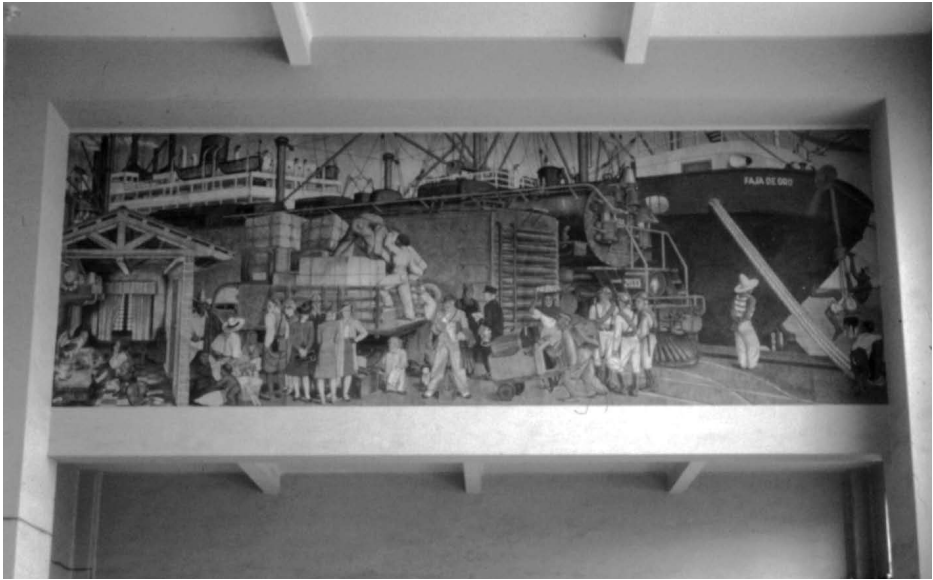
Fernando Leal. La edad de la máquina. Muro poniente de la estación del Ferrocarril de Noreste San Luis Potosí, México. Fresco sobre muro directo, 1942.