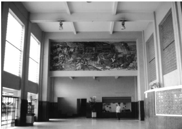
Fernando Leal. El triunfo de la locomotora. Muro oriente de la estación del Ferrocarril de Noreste San Luis Potosí, México. Fresco sobre muro directo, 1942.

N. de E. En un viaje de estudio a San Luis Potosí en julio de 1998 constatamos que los murales de Fernando Leal en la estación de Ferrocarriles se encontraban en buen estado de conservación.