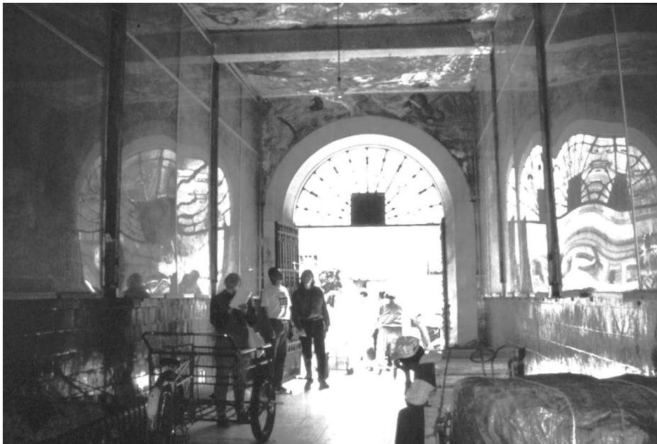
Vista general de los murales de Pedro Rendón.

No existen muchos datos acerca de Pedro Rendón, si acaso tres o cuatro referencias hemerográficas y menciones muy breves en estudios especializados. Pintor, escultor, poeta y "persona que sabe algo de muchos oficios con cierta veta intelectual", 1 candida-