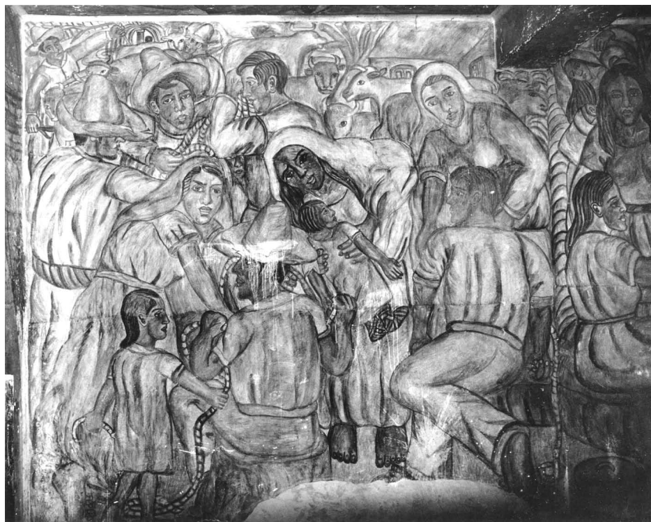
Muro oeste. Detalle.

y se dirige hacia el lado izquierdo. Tiene la función de hilo conductor; a través de los sucesos de la vida cotidiana y el trabajo.