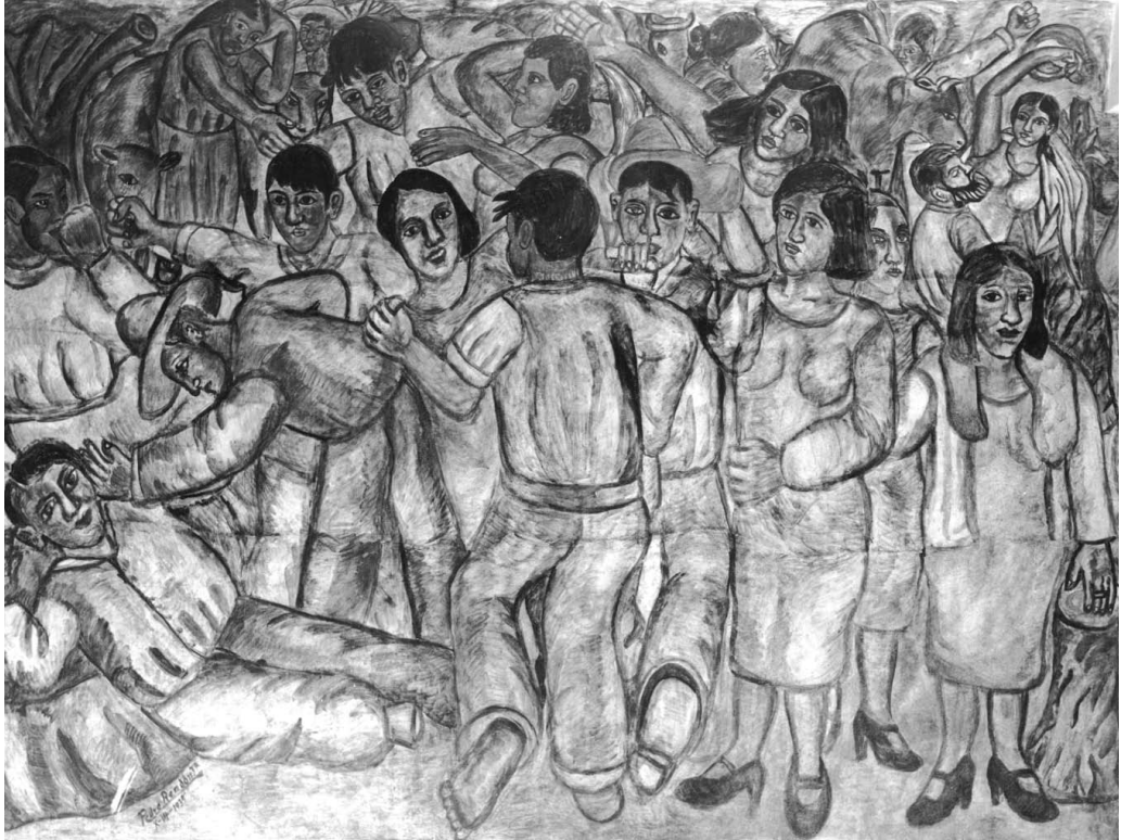
Muro este. Detalle.

La profundidad está dada de acuerdo con la perspectiva de tamaño por medio de bandas horizontales, donde en un mundo sobresaturado, conviven humanos, animales estilizados, árboles deformes que se desenvuelven como masas y volúmenes.