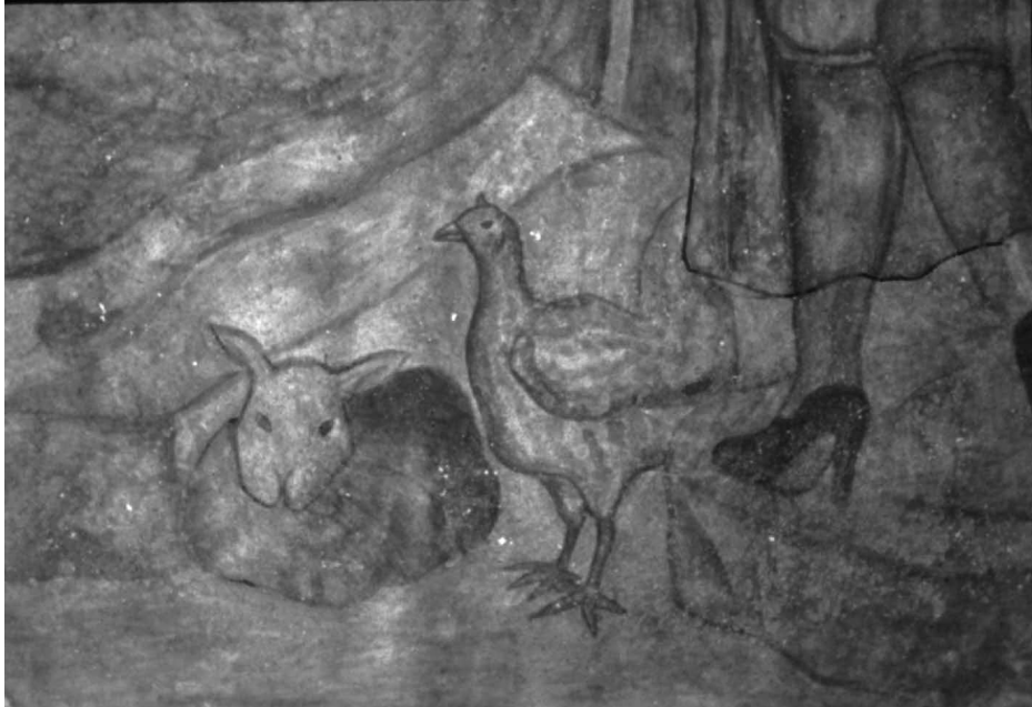
“Gato por liebre”.

ciudad, la transición del paisaje rural al urbano, el crecimiento familiar o su disgregación.