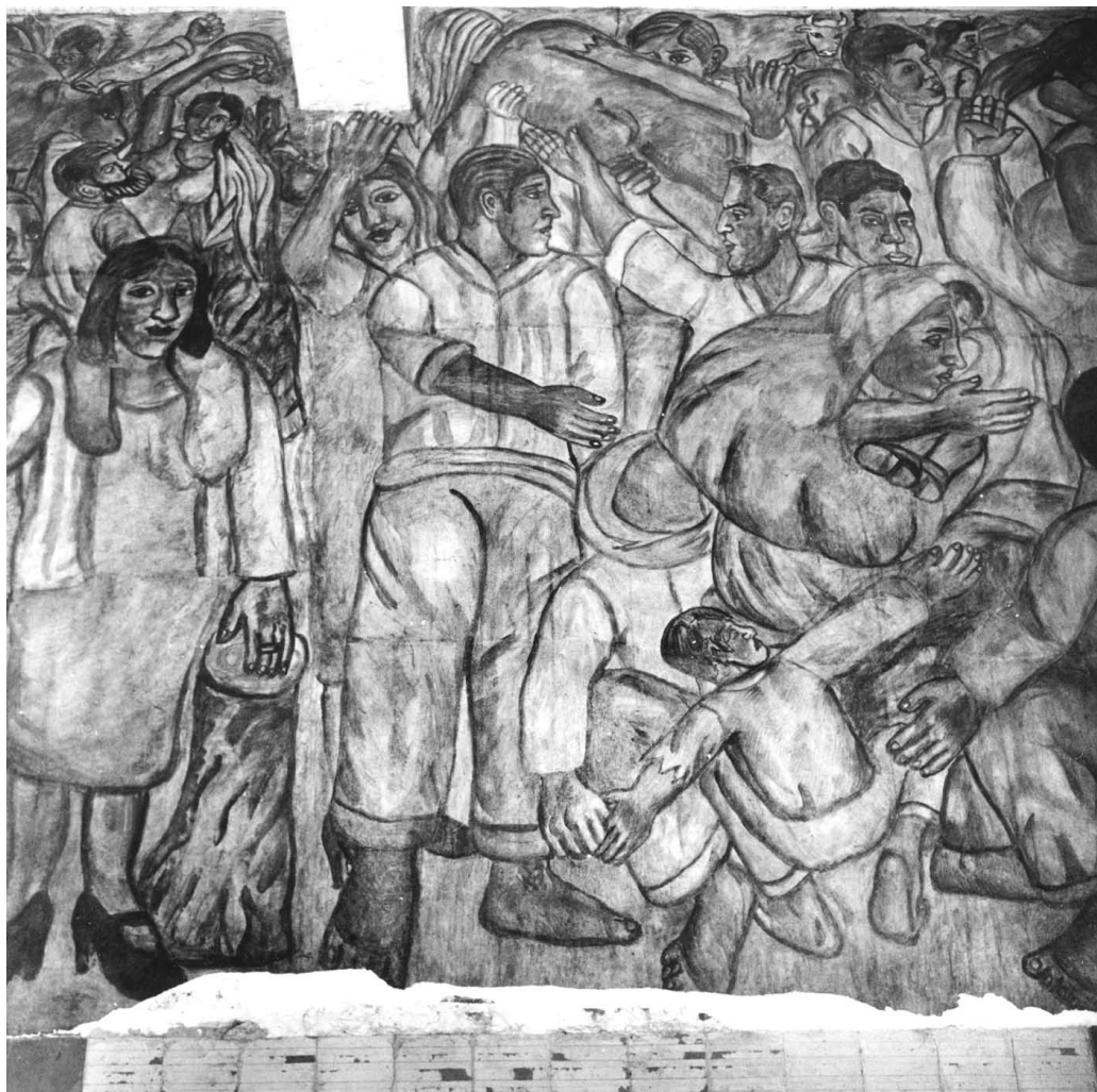
Muro este. Detalle.

tor en ciencias ocultas", como el mismo se caracterizaba, fue una personalidad compleja y extravagante. Si no se ganó