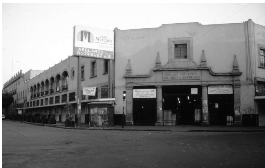
Exterior del mercado.

En los treinta, la ciudad de México contaba solamente con cuatro mercados que no podían satisfacer las necesidades de la población. Se consideraba uno de los problemas más