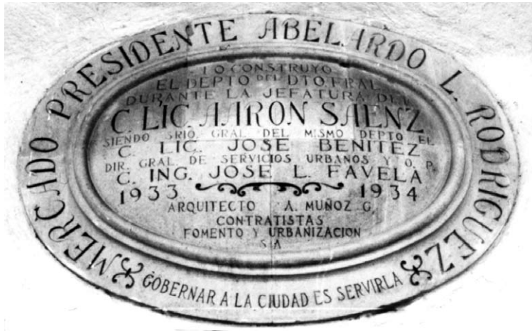
Placa conmemorativa de la apertura del Mercado.

co, como Juan G. Cabral secretario de Gobernación, J. M. Puig Casauranc secretario de Relaciones Exteriores, Pablo Quiroga secretario de Guerra y Marina, Primo Villa Michel secretario de Economía Nacional y Aarón Sáenz jefe del departamento del D.F., entre otros asistentes.