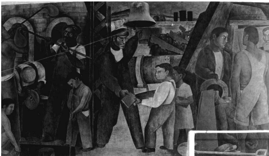
Pablo O'Higgins. La realidad del trabajo y sus luchas . Vista general. Escuela Emiliano Zapata, 1933.

eran el concreto armado en estructuras de techos, cimientos, escaleras y entrepisos; cemento y asfalto en los pisos; metal en las puertas y ventanas; apisonados en los patios; e instalación eléctrica oculta. Inaugurada el 22 de noviembre de 1932, posteriormente siguió el destino de todas las escuelas de grandes dimensiones que se dividieron arbitrariamente en dos, en la década de los sesenta para incrementar así, demagógicamente el número de construcciones escolares, mas no el espacio dedicado a la enseñanza. Una parte de este edificio conserva su nombre y la otra, localizada al sur, se denomina Escuela Jesús Romero Flores. Para decorar los muros de la escuela se comisionó a Pablo O'Higgins, quien rea-