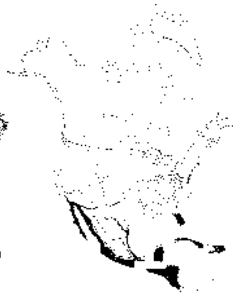
Pleistoceno e interglaciares

la vegetación tropical se “corrió”, hasta más o menos los 23° L. N., con un ligero ascenso durante el Mioceno Medio y Superior, que alcanzó hasta los 26° L. N.