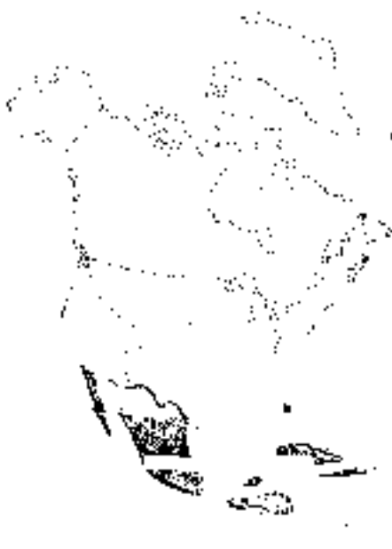
Mioceno medio y tardío