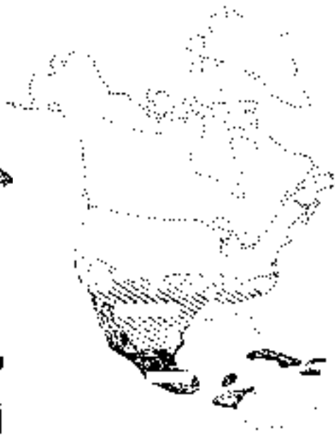
Eoceno tardío y Oligoceno temprano