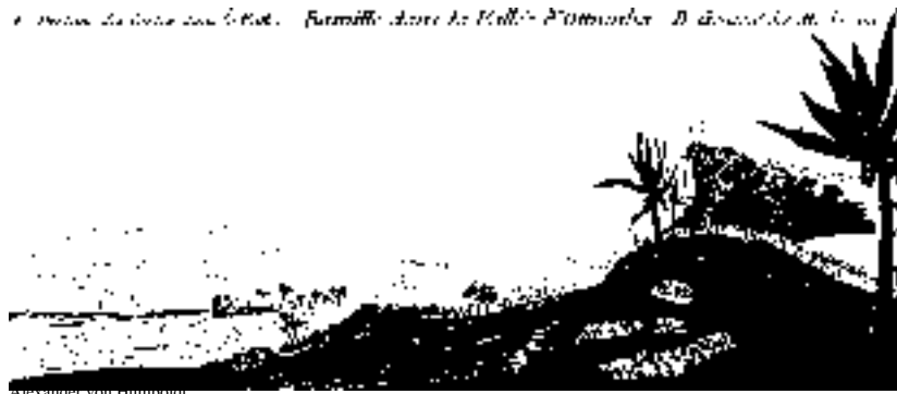
Alexander von Humboldt

Las actividades del hombre han estado ligadas con la biodiversidad de los sitios, desde que el hombre cambió sus hábitos y pasó de cazador-recolector a agricultor y posteriormente a ganadero y para algunas regiones a forestal, comenzando así un largo proceso de modificación de los ecosistemas originales.