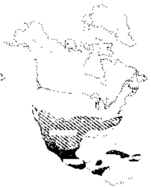
Oligoceno tardío y Mioceno temprano

buferas y marismas en donde se depositaron aguas salobres que al evaporarse propiciaron la concentración de evaporitas, creando hábitats propicios para una biota propia de ambientes salobres, como la de los manglares, pastizales halófilos y en general la vegetación costera.