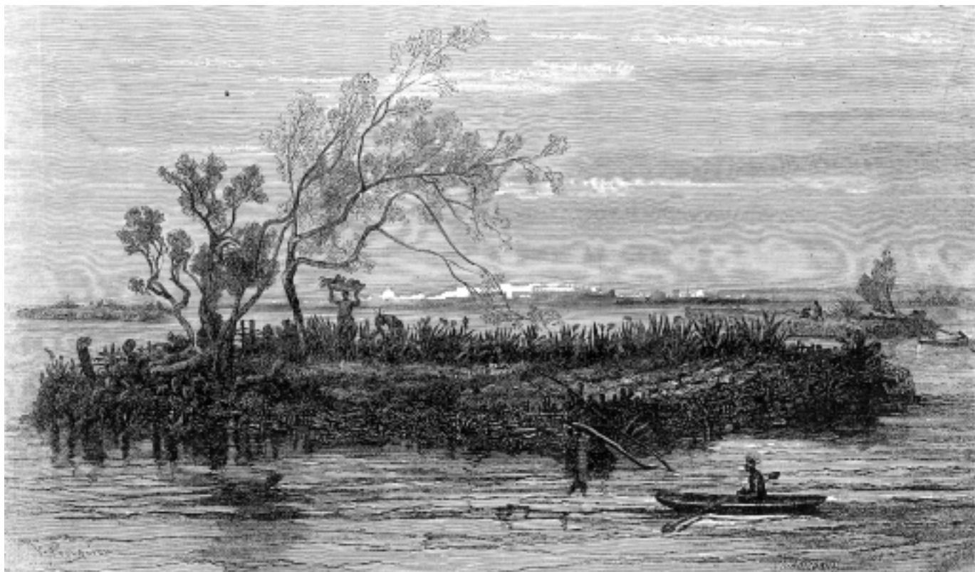
Alexander von Humboldt

fauna, tanto en sentido vertical como horizontal. Hubo un “corrimiento” de la vegetación tropical hacia el sur con la consiguiente invasión de una flora y vegetación templada a bajas latitudes.