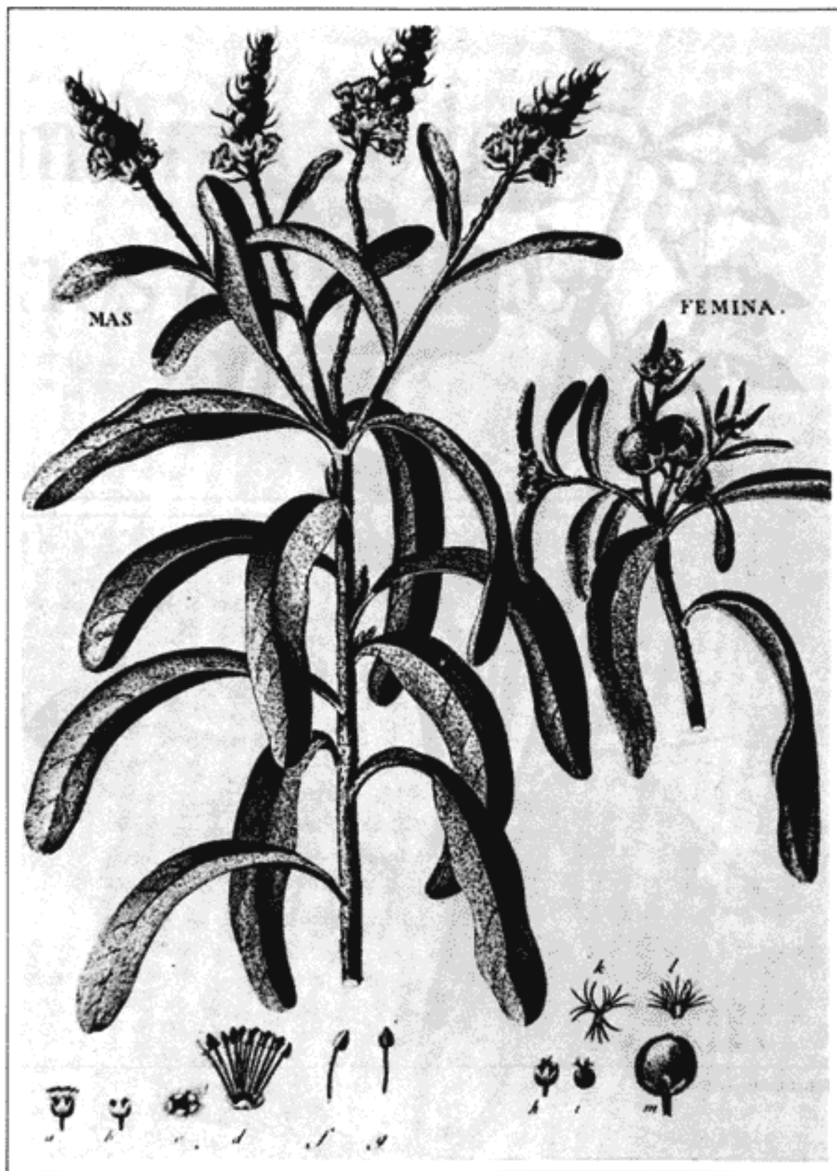
Croton dioicum Cav.