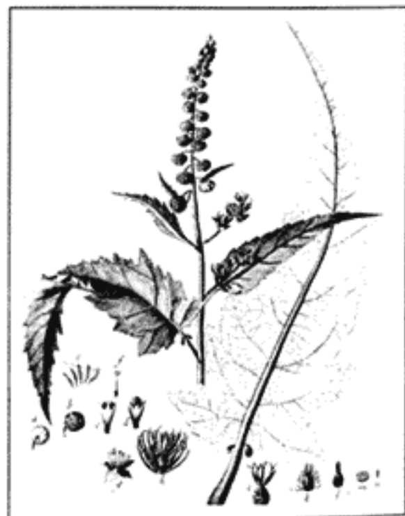
Franseria ambrosioides Cav.

Mucho más escasa es la información que se tiene sobre la presencia de xerófitas fósiles, pero aquí, como es sabido, hay pocas esperanzas de que tales fósiles se preserven más allá de lo esporádico.