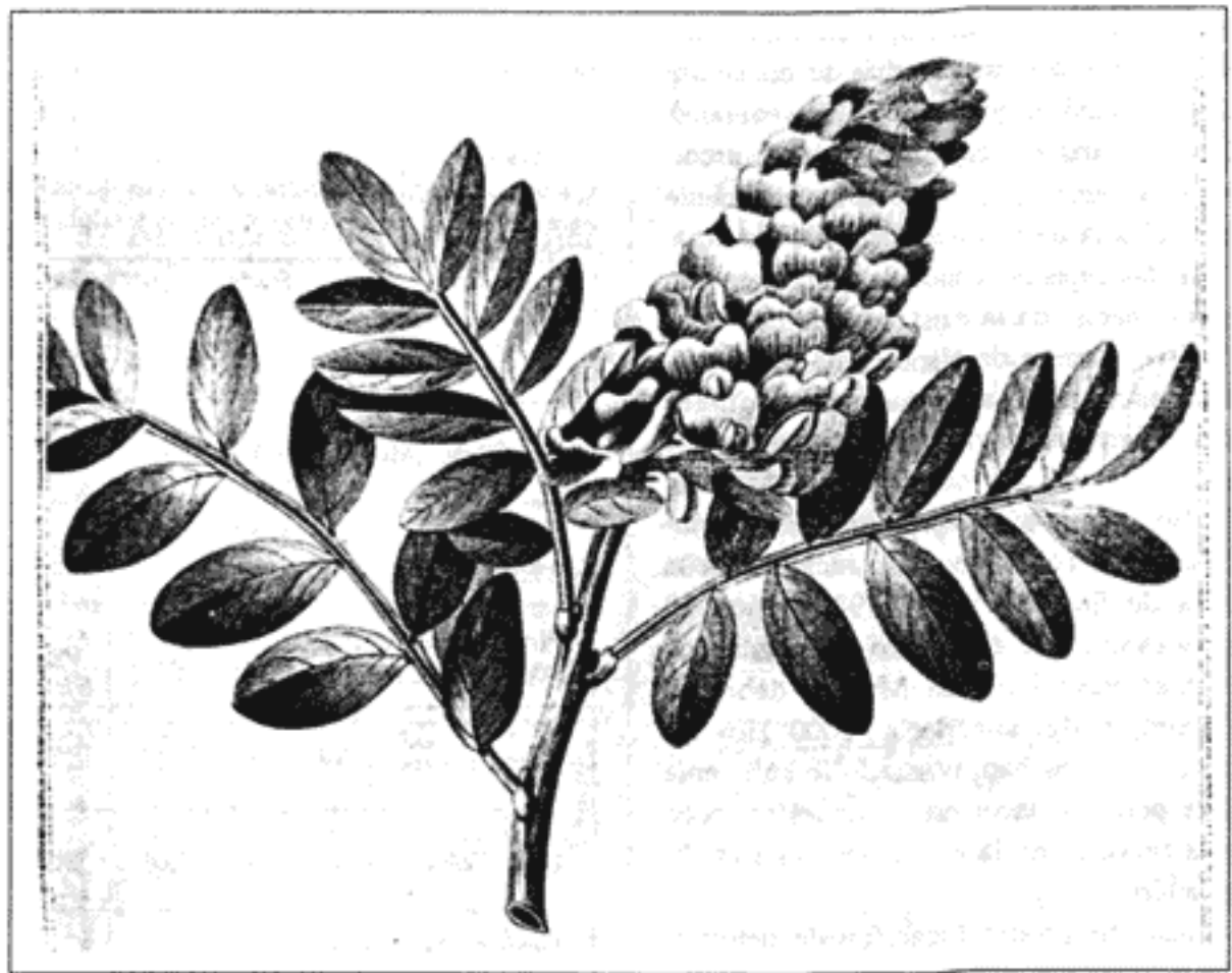
Virgilia secundiflora Cav.