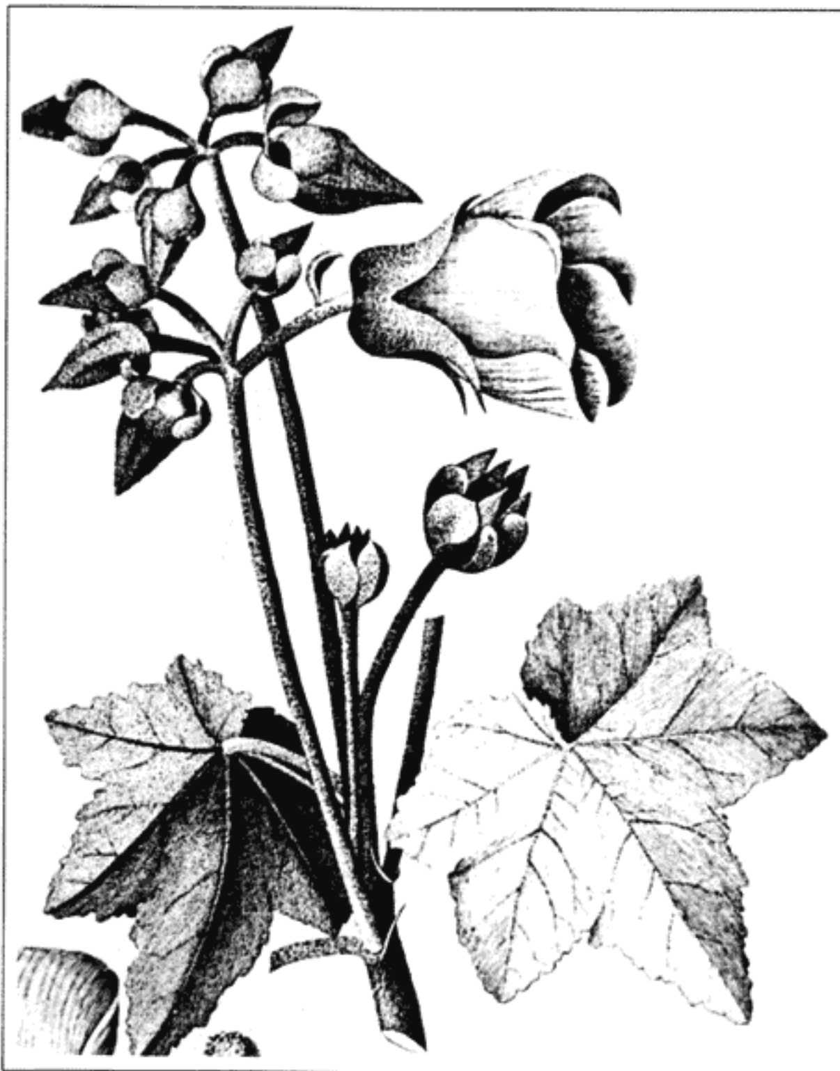
Malva umbellata Cav.