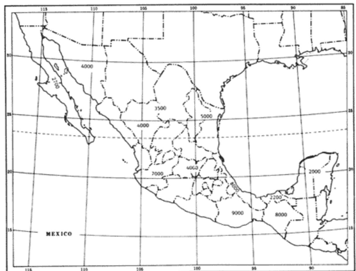
Fig. 1. Riqueza florística actualmente conocida o estimada de algunas regiones de la República Mexicana, expresada en números aproximados de especies de fanerógamas.

De acuerdo con esta valoración los bosques de coníferas y de encino contribuyen con casi una cuarta parte de la flora, mientras que los matorrales xerófilos junto con los pastizales aportan alrededor de 20%. Las "selvas" o bosques tropicales conforman más de un tercio de la flora global, repartido en porciones no completamente equivalentes entre los húmedos por un lado y los semihúmedos y secos por el otro. La participación del