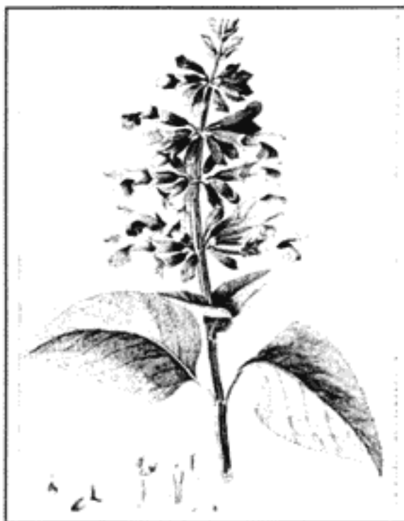
Salvia mexicana L.

La opinión de Gentry (1982) no va muy de acuerdo con este hecho, pero su razonamiento parte de la aceptación del origen gondwaniano de muchos grupos en que tal procedencia sólo es hipotética.