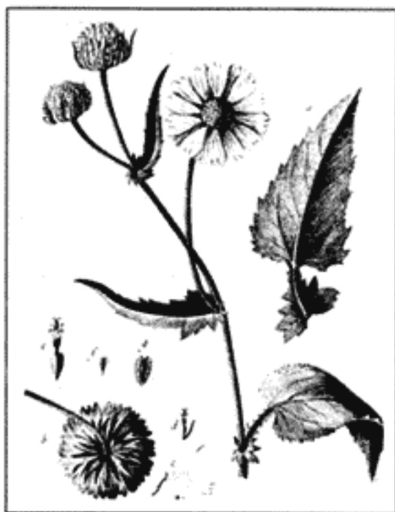
Ximenesia encelioides Cav.

Como ya lo sospecharon Berry (1937), así como Raven y Axelrod (1974: 623), existen muchas probabilidades de que cierta proporción de plantas que en el presente prosperan en México o en el Neotrópico en general, de hecho procede de antecesores laurasiáticos de clima subtropical, pero los linajes correspondientes se extinguieron en muchas partes del Hemisferio Norte con el recrudescimiento del clima en épocas recientes. Es factible que grupos como Annona , Cedrela , Celastrus , Dendropanax , Meliosma , Ocotea , Persea , Saurauia , Stemmadenia , Symplocos , Ternstroemia y muchos otros más, que con los conocimientos actuales resulta difícil detectar, hayan tenido su génesis en esa parte de la corteza terrestre y posteriormente hayan penetrado a Sudamérica.