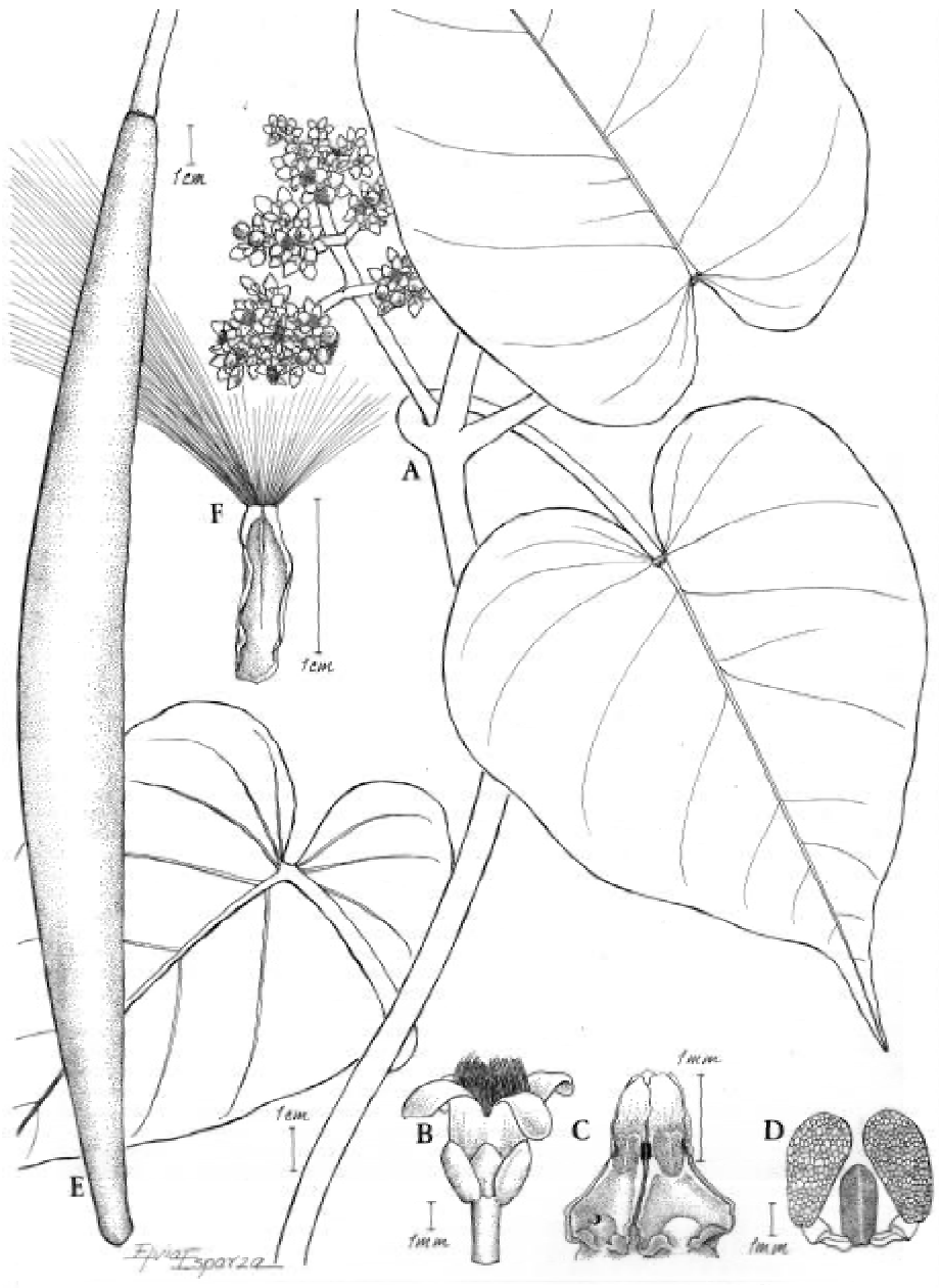
Fig. 1. Marsdenia popoluca : A, rama con inflorescencia; B, flor mostrando los tricomas que surgen de la garganta de la corola; C, ginostegio; D, polinario; E, folículo; F, semilla (Á. Campos 5693, MEXU).