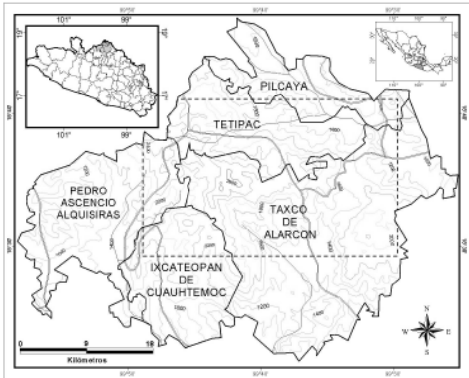
Fig. 1. Localización de la zona de estudio.

En su parte más alta alcanza alturas superiores a los 2 500 m y es allí donde se originan las cadenas montañosas que en la vertiente interior se dirigen al río Bal-