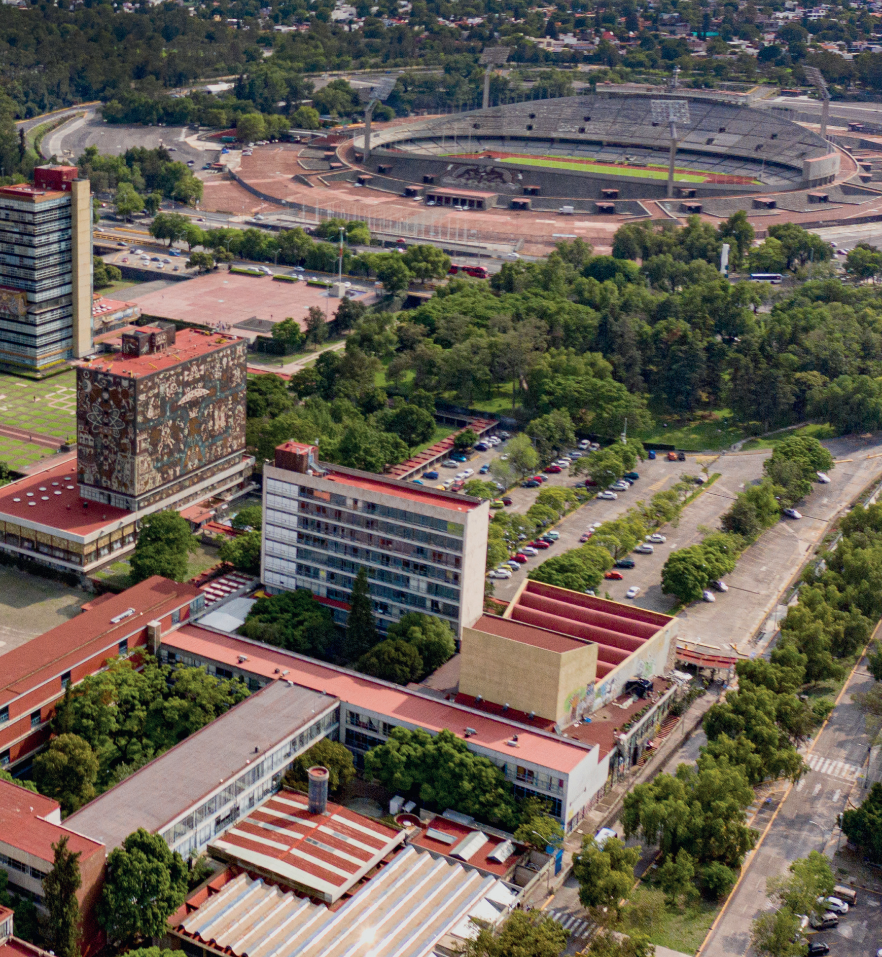
Vista area de Ciudad Universitaria, agosto de 2022.