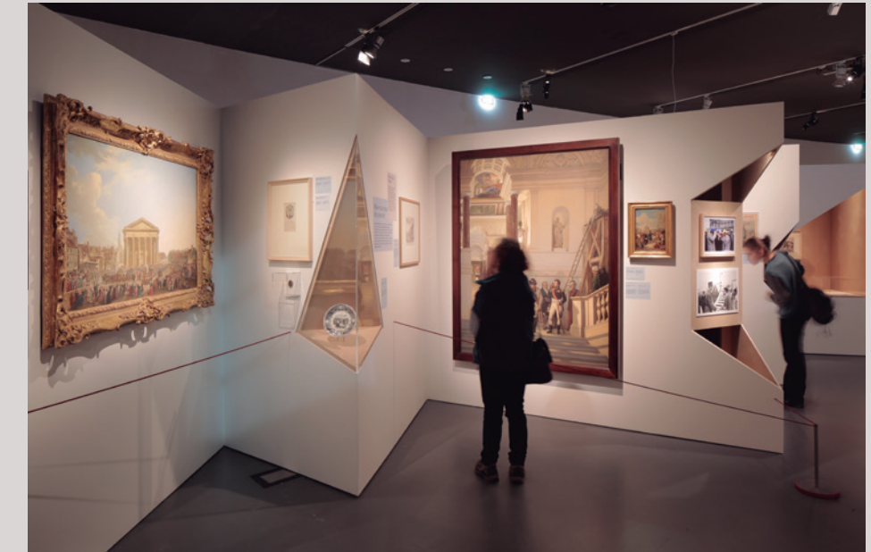
Vista de la exposición L'Art du chantier , 2018