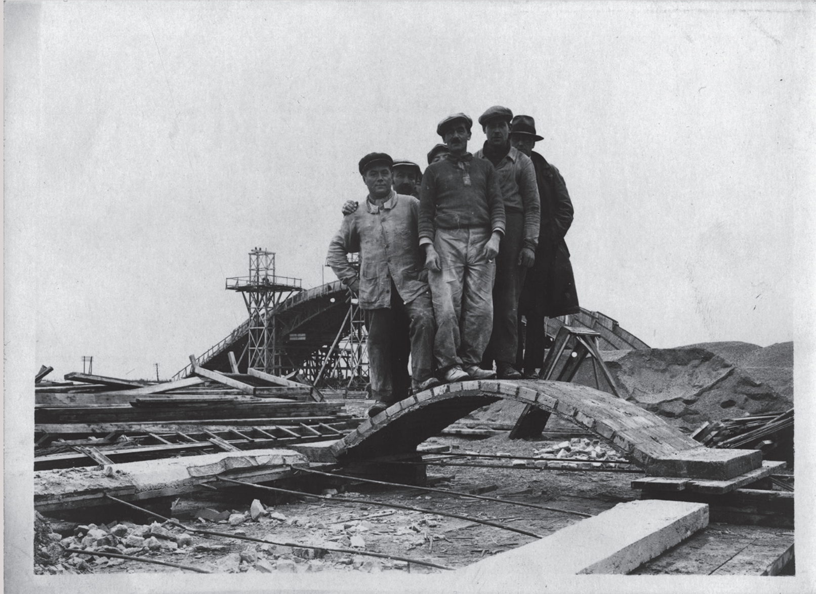
Ensayo de resistencia de unas bóvedas en bloques de hormigón celular