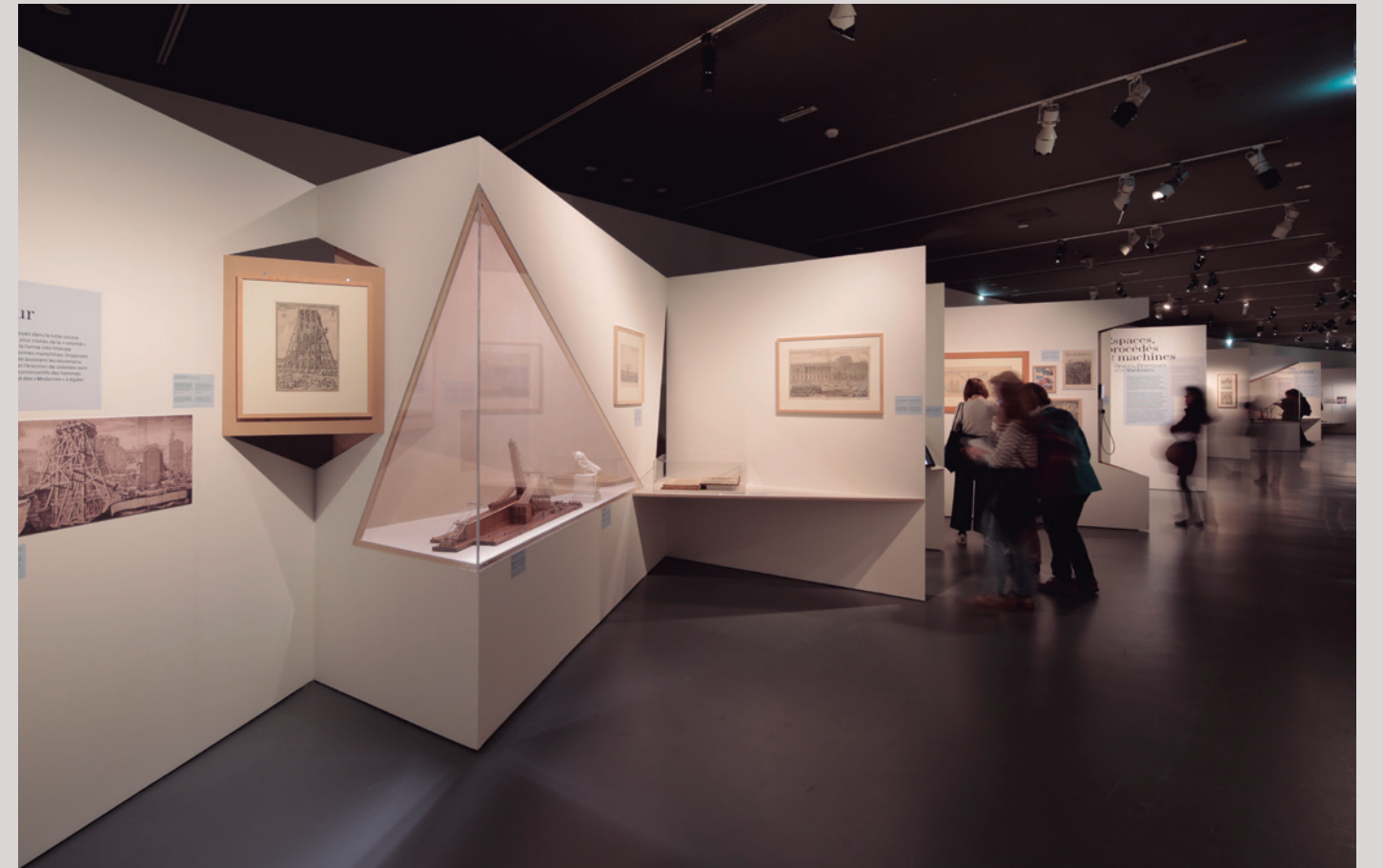
Vistas de la exposición L'Art du chantier , 2018