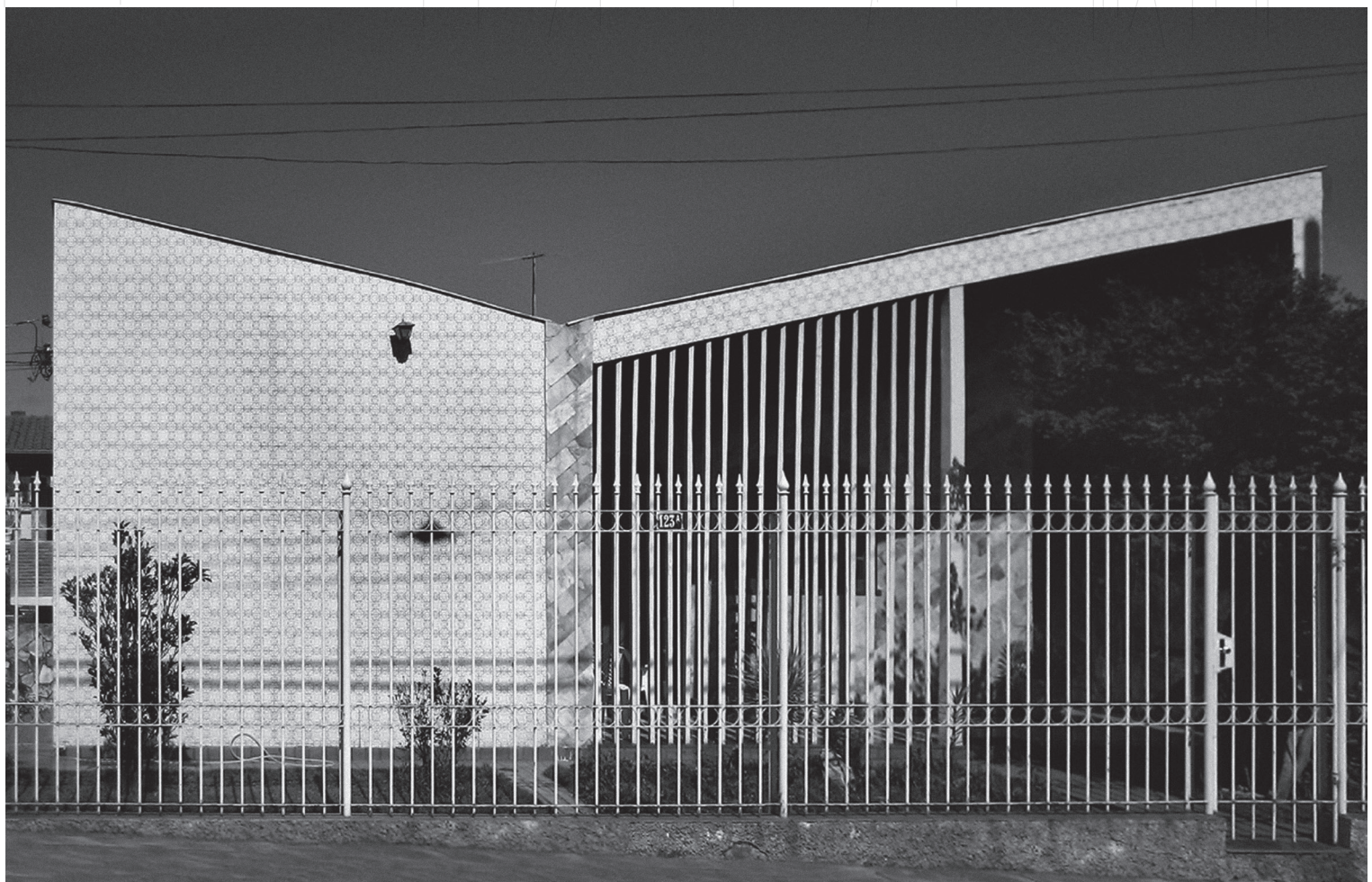
Fachada moderna documentada en Belo Horizonte .