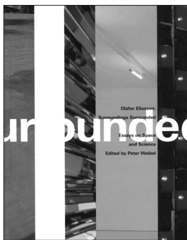
Peter Weibel (editor) Olafur Eliasson: Surroundings Surrounded Essays on Space and Science MIT Press, 2001 ISBN: 978-0262731487