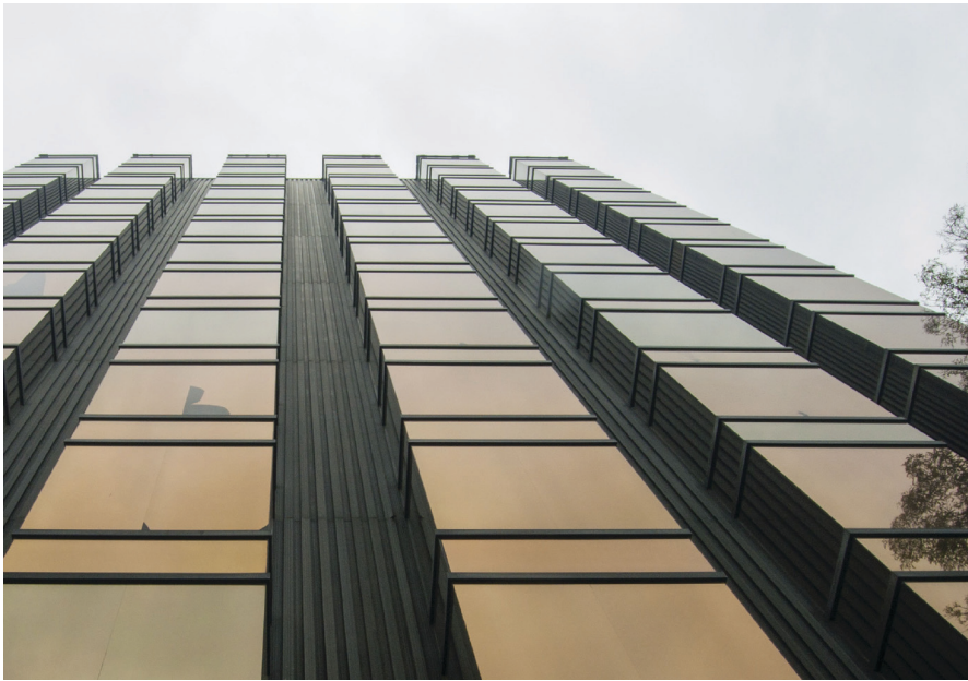
Edificio de la Secretaría de Turismo. Hegel y Masaryk, Polanco Ciudad de México.