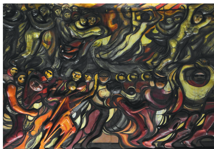
David Alfaro Siqueiros La marcha de la humanidad, interior del Polyforum Cultural Siqueiros.

El Polyforum Cultural Siqueiros fue inaugurado con gran fastuosidad el 15 de diciembre de 1971, con la presencia del presidente Luis Echeverría Álvarez, diversas personalidades políticas y culturales, y el pintor. 19 Recientemente, en 2011, sus dueños lo sometieron a una renovación respetuosa de los espacios interiores, pero adolece aún de graves problemas para la conservación de los murales. Ésta es la razón por la que recientemente propusieron girarlo y moverlo, para permitir la construcción de una torre que les permita solventar esos gastos; sin embargo, el permiso fue negado en atención a la conservación de la integralidad del inmueble y no sólo de sus murales.