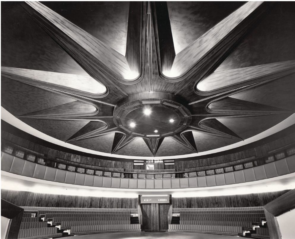
Detalle del plafón del teatro del Polyforum Cultural Siqueiros, Ciudad de México