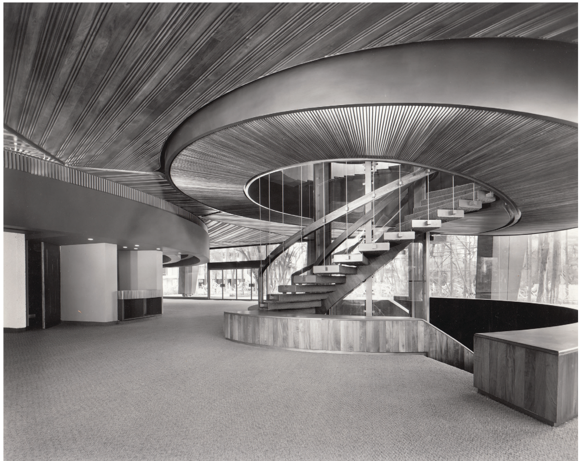
Detalle de la escalera principal del Polyforum, Ciudad de México.

Respecto a esta parte de la construcción, hay una entrevista hecha posteriormente a Ramón Mikelajáuregui; en ella declaró que la estructura del Polyforum estuvo a cargo del ingeniero Ma-