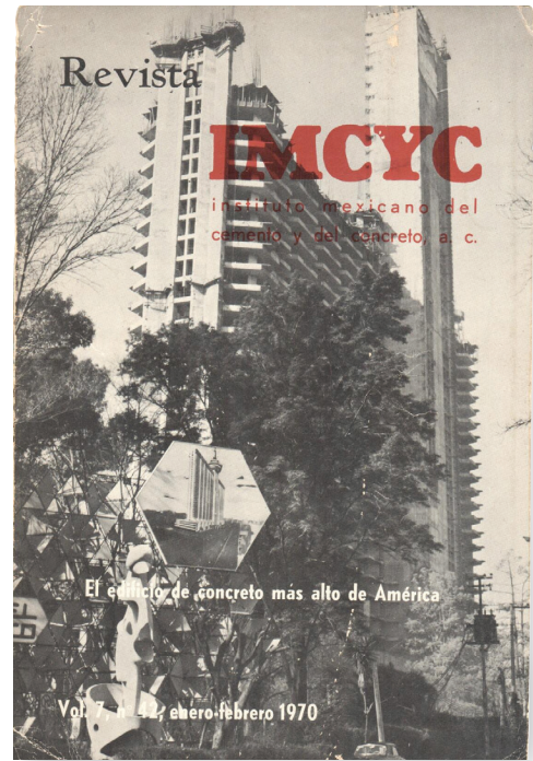
Portada de la revista IMCYC , 1970, con el Hotel de México en construcción