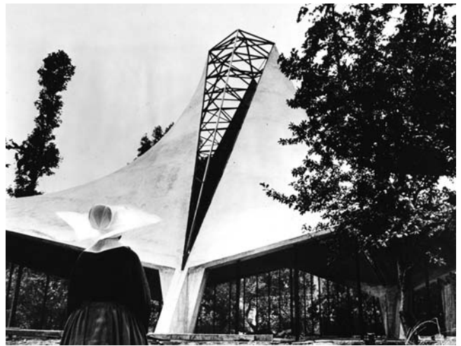
Una monja con su característica cofia, motivo de inspiración de la cubierta de la Capilla de San Vicente de Paul, Coyoacán, D.F., 1959. Enrique de la Mora, Fernando López Carmona, Félix Candela.

La exhibición reúne documentos, planos, perspectivas, dibujos y fotografías que Juan Ignacio del Cueto ubicó en los