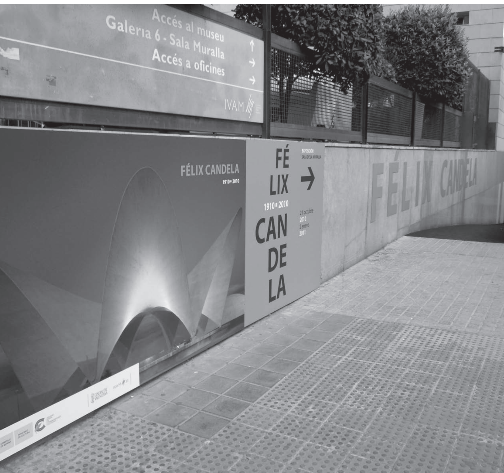
Acceso a la Sala de la Muralla del Instituto Valenciano de Arte Moderno (IVAM), primera sede de la exposición Félix Candela .

Doctora en historia. Investigadora del Instituto Mora