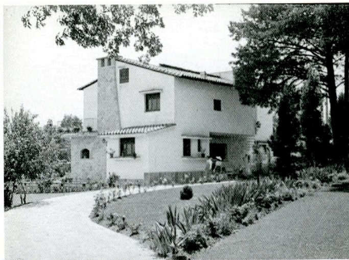
Casa para Daniel Cosío Villegas, 1944