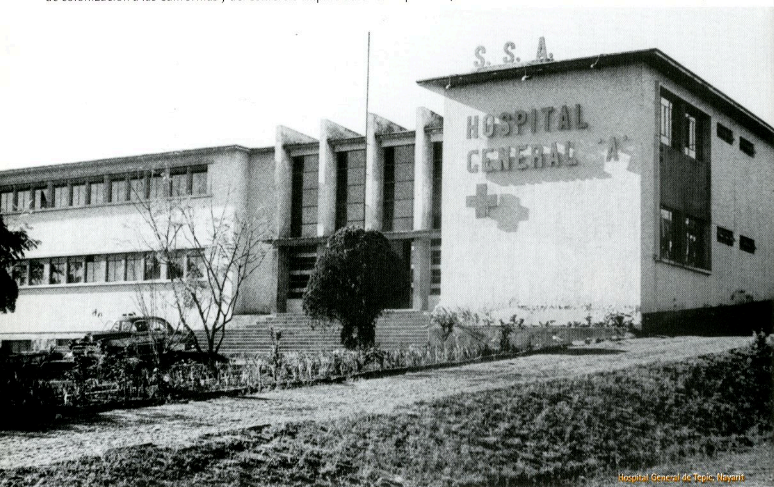
Hospital General de Tepic, Nayarit