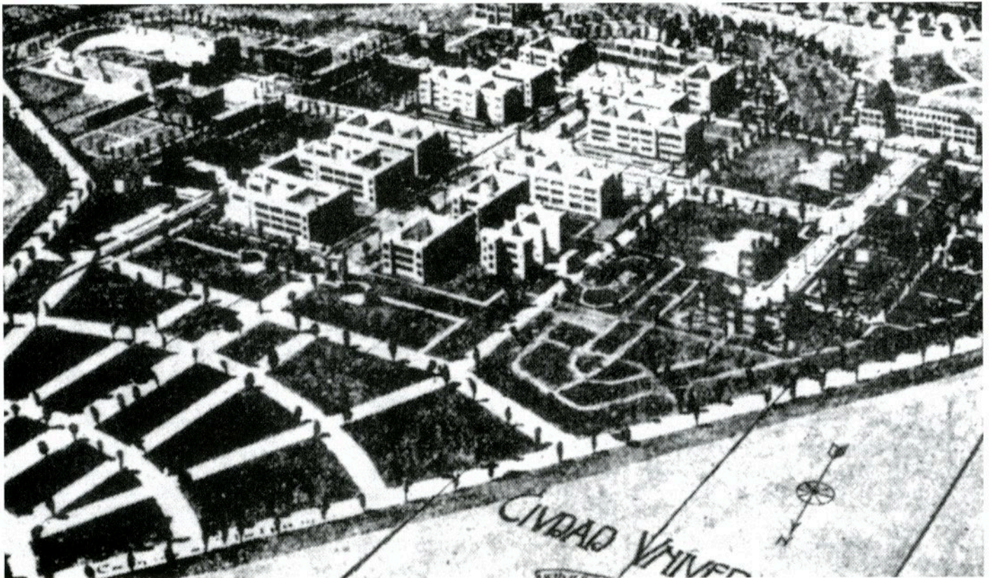
Plano de una Ciudad Universitaria. Tesis profesional 1928