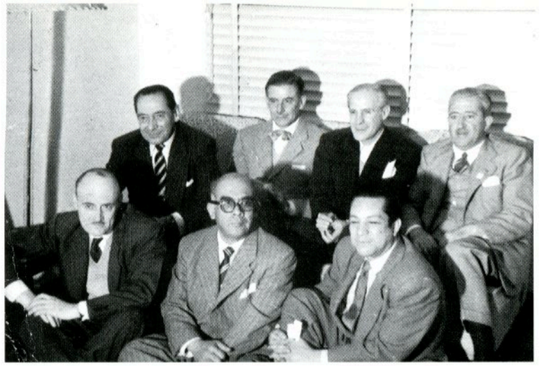
Retrato de 25 aniversario de generación de arquitectura