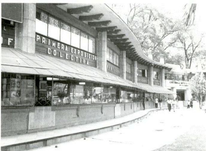
Arturo Sáenz de la Calzada (Álava 1907-México 2003). Adecuación de las pérgolas del Palacio de Bellas Artes para librería y galería de arte (primera Librería de Cristal), México DF, 1940.