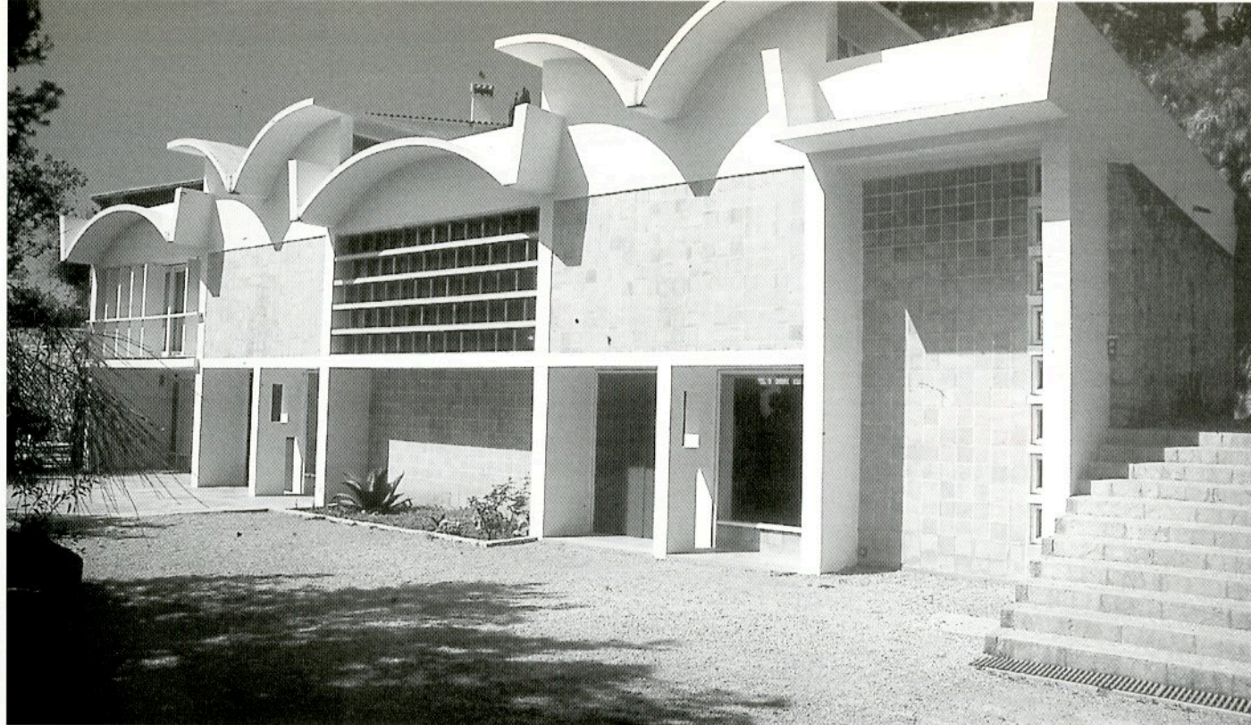
José Luis Sert (Barcelona 1902-1983). Estudio para Joan Miró en Palma de Mallorca, 1957. Considerado uno de los padres de la arquitectura moderna en España y exiliado en EEUU, Sert realizó el proyecto mientras fungía como director de la Escuela de Diseño de Harvard.