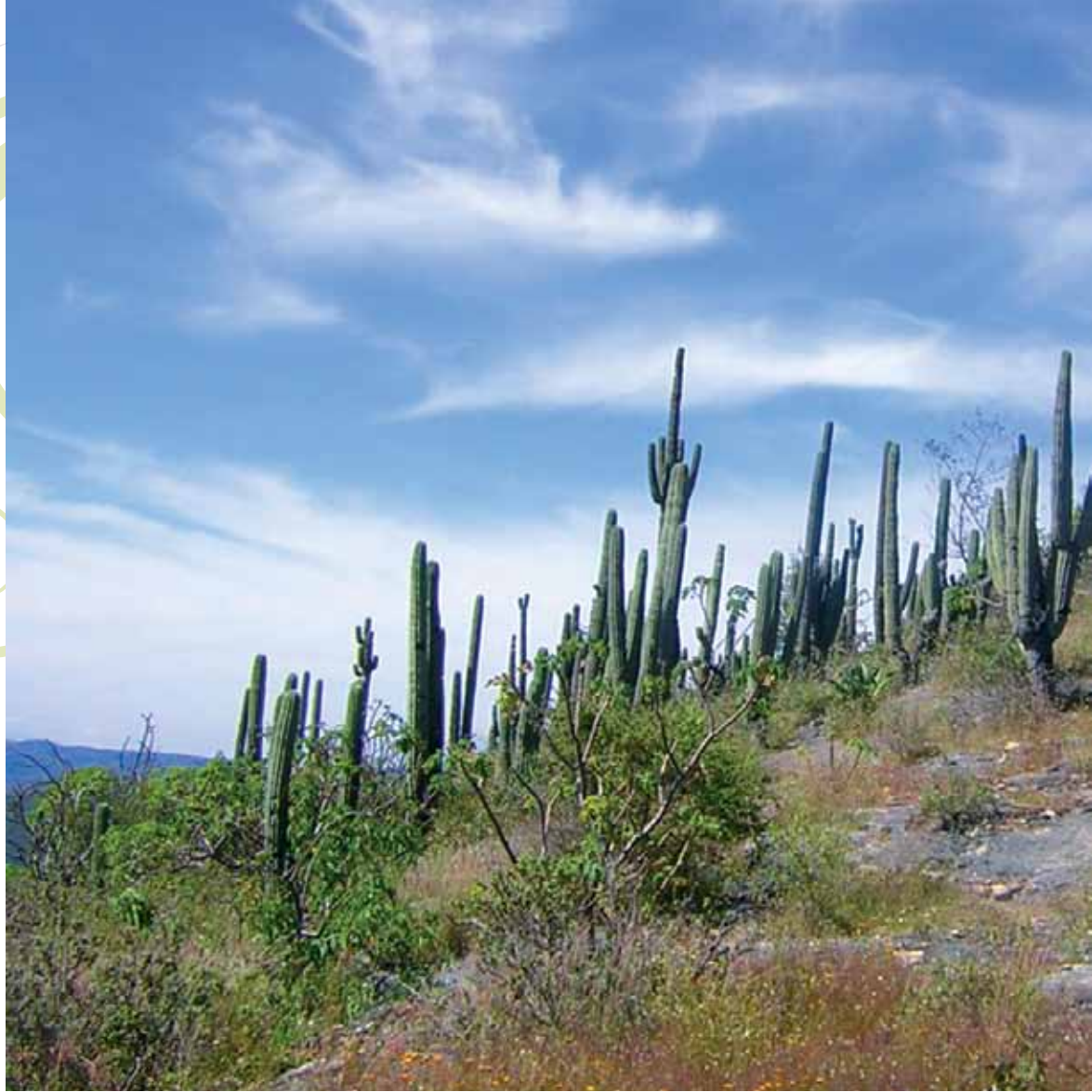
Vegetación nativa en Hierve el Agua, Oaxaca

un vacío que deje hablar su presencia. Los espacios de su arquitectura están en silencio, en vacío, y son los recipientes abiertos que evidencian esa manifestación natural en los términos que el arquitecto ha imaginado. Los especialistas consideramos a Luis Barragán como el primer arquitecto paisajista mexicano. Creo que sin el prestigio nacional e internacional de su obra, esta carrera hubiera tenido otro derrotero y tal vez la dificultad de crearla hubiera sido mayor.