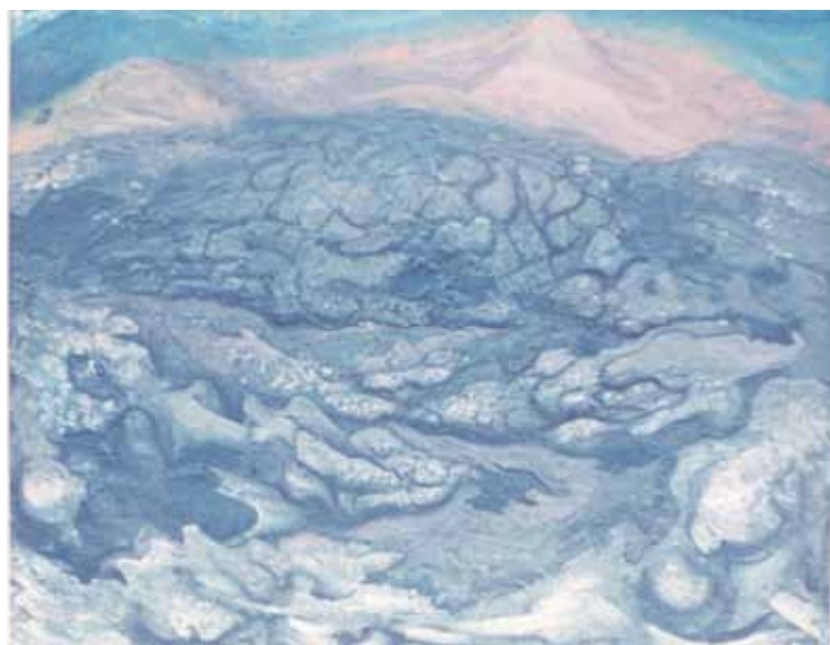
David Alfaro Siqueiros, Pedregal , 1946

El Pedregal de San Ángel está ligado a otro personaje imprescindible para la arquitectura de paisaje en México: Luis Barragán (1902-1988), magistral creador de espacios habitables que introdujo la naturaleza como parte indisociable del diseño arquitectónico, lo que requiere de un enorme conocimiento de la misma. Sin embargo, la colaboración con la naturaleza en el caso de Barragán no surgió de un estudio metódico o académico especializado sino de la observación sensorial y espiritual. Para escuchar a la naturaleza se requiere de quietud y silencio; para presenciar su latido se requiere de