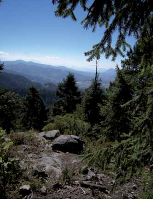
Santuario de la mariposa Monarca, Chincua, Michoacán

Después de la intervención francesa de 1864 surgieron en varias ciudades y en la capital grupos cada vez más nutridos de naturalistas, en su mayoría médicos, farmacéuticos e ingenieros. A todos los unió el interés por estudiar y aprovechar mejor los recursos naturales del país. En 1868 se agruparon en la Sociedad Mexicana de Historia Natural y un año después apareció el primer fascículo de La Naturaleza , revista cuya publicación a cargo de Manuel María Villada tocó temas de botánica, zoología, geología y paleontología.