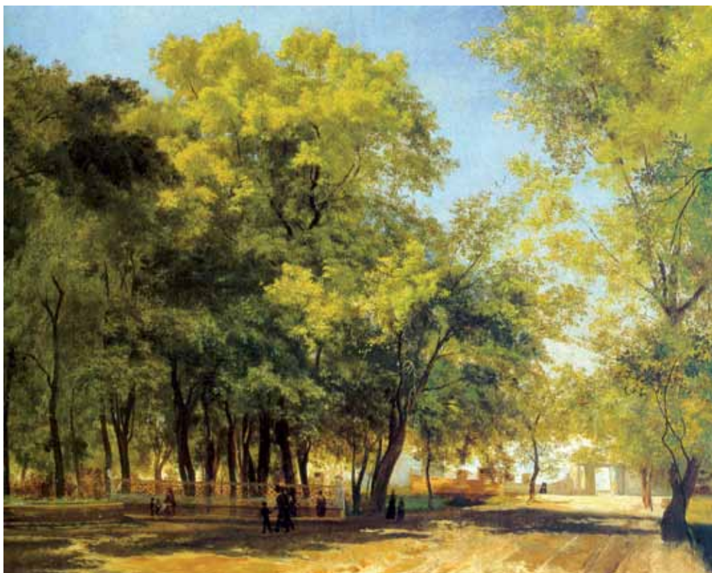
José María Velasco, La Alameda de México por el lado de San Diego , 1863

Academia de San Carlos en 1858 para aprender dibujo. Apenas tres años antes se habían agregado a las carreras de pintura, escultura y grabado, la de "paisaje" y un año después la de arquitectura. Eugenio Landesio, profesor de pintura de paisaje, formado en la escuela de pintura romántica, reconoció en Velasco enormes cualidades que le enseñó a explotar. Además de profundizar en las técnicas pictóricas, a lo largo de su vida creció su interés en las ciencias, especialmente botánica, zoología y geología, así como en materiales y sucesos del pasado mesoamericano. Colaboró en la obra Flora del Valle de México realizando dibujos botánicos, después de lo cual fue nombrado socio de número de la Sociedad Mexicana de Historia Natural; trabajó también para el Museo Nacional en la reproducción de piezas y pinturas de sitios arqueológicos. No quiero dejar de mencionar las bellas composiciones arqueológicas del maestro en las que representó por ejemplo Teotihuacán y los baños de Nezahualcōyotl.