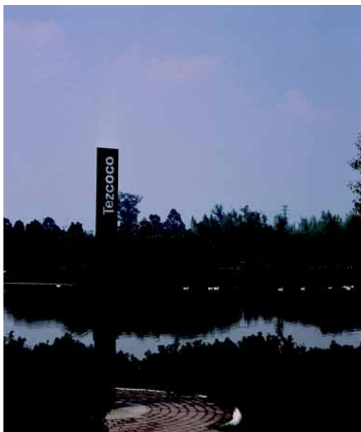
Parque Tezozomoc, Ciudad de México

Hay aquí un gran espacio para trabajar que, digámoslo, linda con la utopía, pero nada grande se ha hecho sin bordear los límites de lo posible y en nuestros días ya nos hemos acostumbrado a ver situaciones que hace unos pocos años se consideraban imposibles. Si existe una visión reductiva de la arquitectura de paisaje como jardinería, pues bien, quisiéramos conseguir que todo el planeta fuera un jardín: hortus conclusus terrae . Ésta es nuestra utopía. 📍