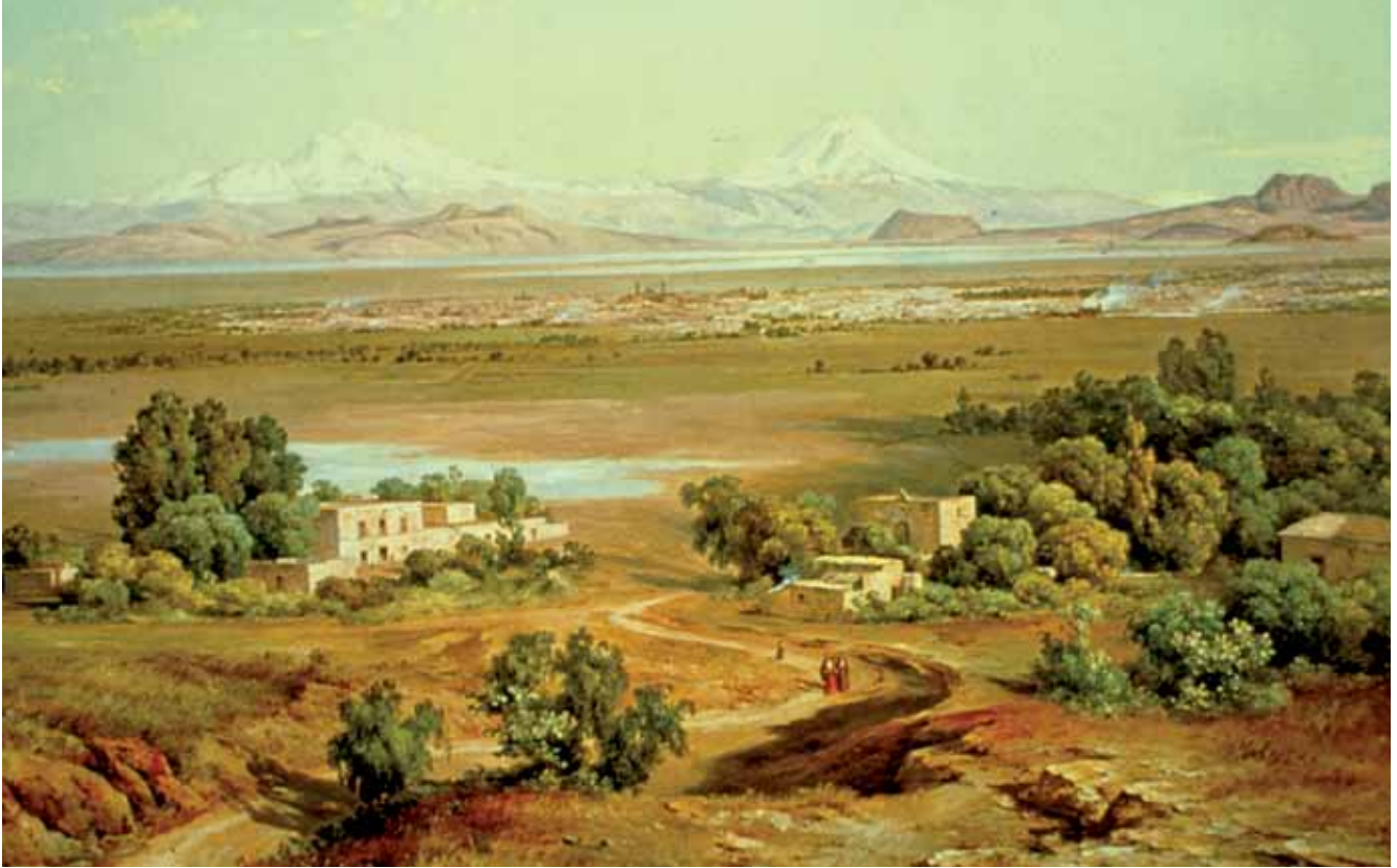
José María Velasco, Valle de México desde el Tepeyac , 1901

el científico-racional y el estético-ético. Esta disciplina utiliza el conocimiento racional cuantitativo para conseguir un despliegue estético del ámbito social. En la confluencia las dos formas de conocimiento son transformadas y su mutua influencia les confiere un nuevo sentido. Tiene además el reto de potenciar cada una de estas grandes tendencias con la otra, haciendo real la capacidad estética del ser humano a través de la capacidad racional, que de otro modo se queda en su fase contemplativa, como es el caso del arte. Esto significa también darle un contenido estético lúdico a la capacidad racionalista, que de otro modo se quedaría en la exacción de la naturaleza reduciéndola y condenándola a un único objeto de uso. Por medio de esta disciplina las dos tendencias del conocimiento ya conjugadas le dan a la naturaleza un valor por su grandeza, misterio y belleza y no solamente por su utilidad. Parafraseando a Kant, la capacidad del conocimiento racional sin la estética es ciega y la capacidad estética sin la científica es virtual, es decir no operativa.