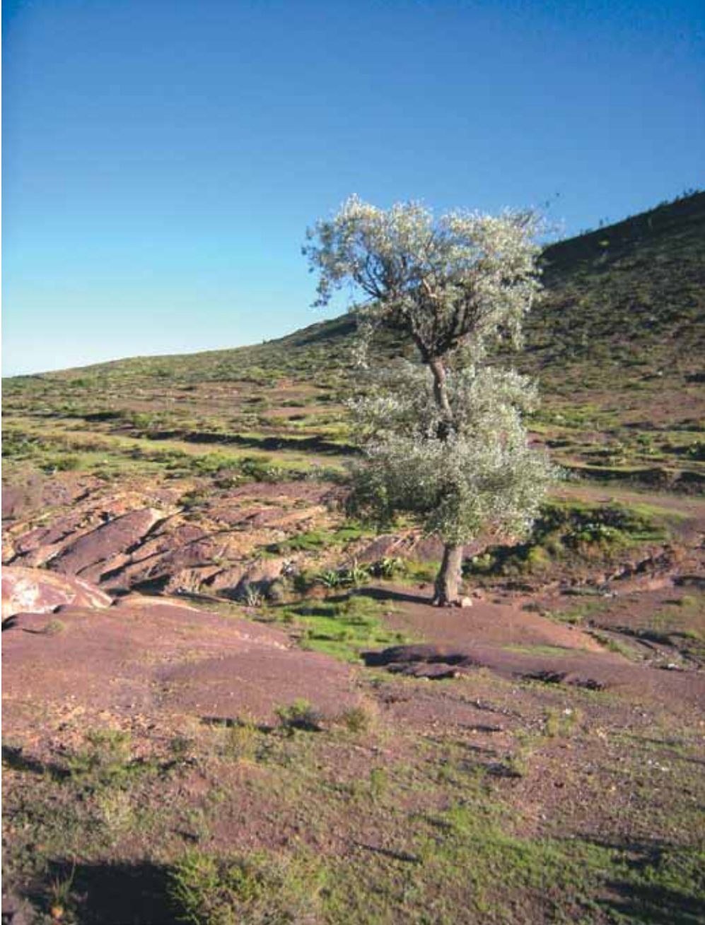
Paisaje en los alrededores de Real de Catorce, San Luis Potosí