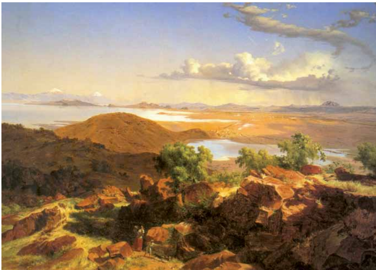
José María Velasco, Valle de México desde el cerro de Santa Isabel, 1875

El nacimiento histórico de la arquitectura de paisaje se dio en una situación privilegiada: el momento de la confluencia de las dos grandes tendencias del conocimiento de la modernidad: