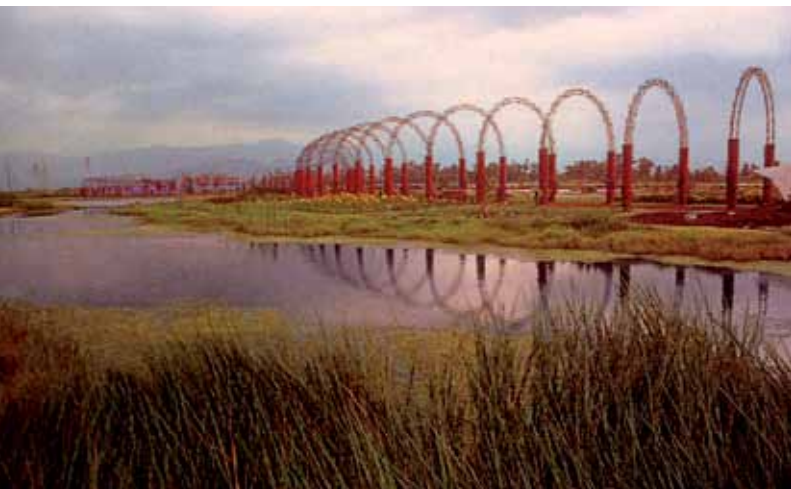
Parque Ecológico de Xochimilco, diseñado por Mario Schjetnan

Este contexto de crisis mundial ha propiciado que la arquitectura de paisaje adquiera importancia crucial en la gestión responsable a través de una interacción creativa de los recursos naturales ante el crecimiento de las zonas urbanas y su población.