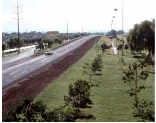
▲► Vistas del Paseo Toluca, Estado de México

La arquitectura de paisaje debe ser consciente de que configura el ámbito del hábitat humano en su relación con todos los seres vivos y el conjunto de la naturaleza. Debe, pues, abandonar la idea de que trabaja en una sociedad instituida, para dar paso a su inserción en los mecanismos de la sociedad instituyente