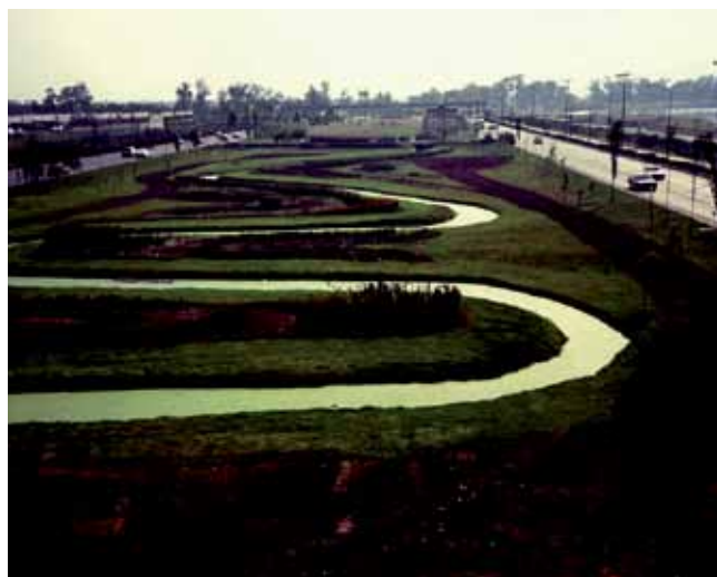
Camellón del Anillo Periférico en el Parque Ecológico de Xochimilco

Parecería que tenemos todos los elementos, un reconocimiento sobre el paisaje mexicano, una teoría, personajes clave de la arquitectura de paisaje y una Facultad de Arquitectura con todas las posibilidades de acoger esta nueva carrera, pero si no hay alguien que lo conjugue y lo tome como un sueño