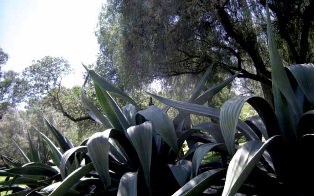
Jardines del Museo "Dolores Olmedo Patiño"

...el paisaje “no tiene una existencia autónoma porque no es un lugar físico sino una construcción cultural, una serie de ideas, de sensaciones y sentimientos que surgen de la contemplación sensible del lugar”