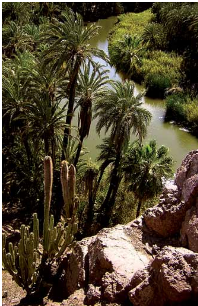
El oasis de Mulegé, BC Sur

La tecnología ha avanzado enormemente y las posibilidades de conocer nuestro mundo se han multiplicado de manera exponencial; contamos con apoyos satelitales, microscopios electrónicos, megacomputadoras y herramientas de comunicación nunca antes vistas; sin embargo, el equilibrio del medio ambiente nunca había estado tan deteriorado. Desafortunadamente la sensibilidad estética y ética para utilizar estos apoyos no ha avanzado a este mismo ritmo vertiginoso. México es un país de extraordinaria riqueza ecológica que alberga 10% de las especies del planeta y contiene una enorme diversidad cultural. Como he insistido, nuestro paisaje es nuestra mayor riqueza; no obstante, el país ha perdido 26% de la superficie que ocupaban originalmente sus selvas y bosques con la de-saparición implícita de miles de especies vegetales y animales al tiempo que la riqueza de las lenguas indígenas sigue disminuyendo. El reto es mayúsculo: la tarea de la arquitectura de paisaje es utilizar las herramientas tecnológicas para crear el "ámbito" correspondiente a nuestras riquezas, para diseñar un paisaje mexicano en el que se exprese lo inefable de su potencialidad.