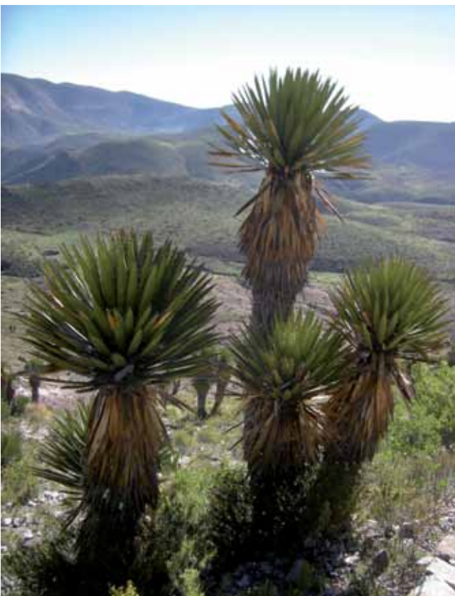
Paisaje desértico en San Luis Potosí

La disciplina se volvió una profesión universitaria en los Estados Unidos, y quedó ligada a Frederik Law Olmsted, diseñador del Central Park de Nueva York en 1858 y creador del primer Parque Nacional del mundo en Yosemite. Olmsted utilizó el término "arquitecto paisajista" para referirse al profesional, que tomó de John Loudon, quien lo acuñó en 1822. Creía que el propósito de su arte era el de influir en las emociones; para ello, en el diseño de parques creó escenarios donde el visitante quedaba inmerso experimentando la capacidad restaurativa del paisaje en un proceso que calificó de "inconsciente". Siguió sus pasos su hijo homónimo y su sobrino John Charles, miembros fundadores de la Sociedad Americana de Arquitectos Paisajistas en 1899 apenas cuatro años antes de la muerte de su padre. Esta sociedad se creó buscando que la profesión fuera reconocida en el país y para desarrollar los estudios de Educación en Arquitectura de Paisaje que un año después ya se ofrecía en la Graduate School of Design de Harvard en Estados Unidos.