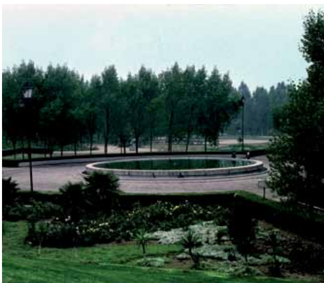
Parque Tezozomoc, Ciudad de México