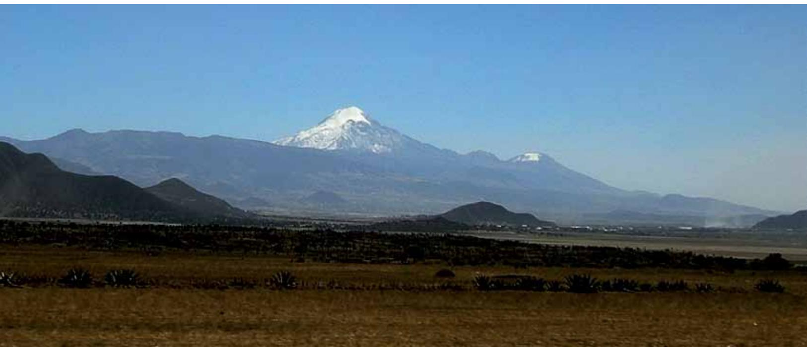
El Pico de Orizaba desde el Valle de Perote

Arquitecta paisajista, maestra en arquitectura, investigadora del Centro de Investigaciones y Estudios de Posgrado, Facultad de Arquitectura, UNAM