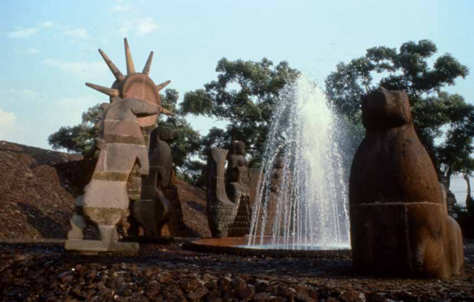
Conjunto escultórico en el Paseo Tollocan