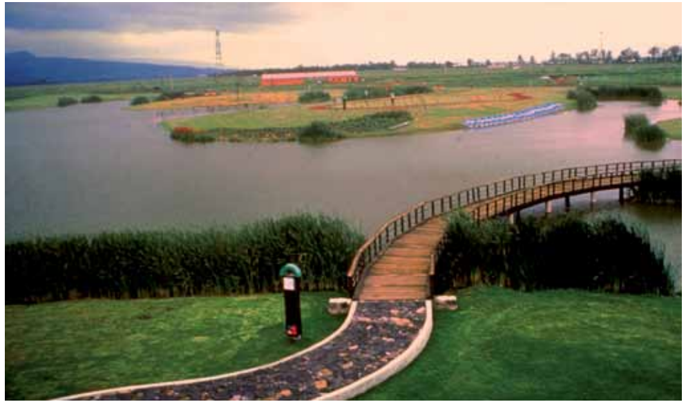
Parque Ecológico de Xochimilco, diseñado por Mario Schjetnan