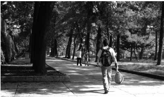
Camino al Estadio de Prácticas

Sus espacios abiertos tienen cualidades que difieren de otros proyectos similares, por una parte se aplicó el principio de integración plástica al incluir obras de diversos artistas que confieren identidad a cada espacio y revierten la tendencia a la estandarización. Por otra parte, la escala humana se integra de manera exitosa en los espacios abiertos, además de considerar las condiciones ambientales de Caracas. El resultado es que los espacios de ese campus se convirtieron en importantes sitios de reunión para la comunidad y la ciudad. 12