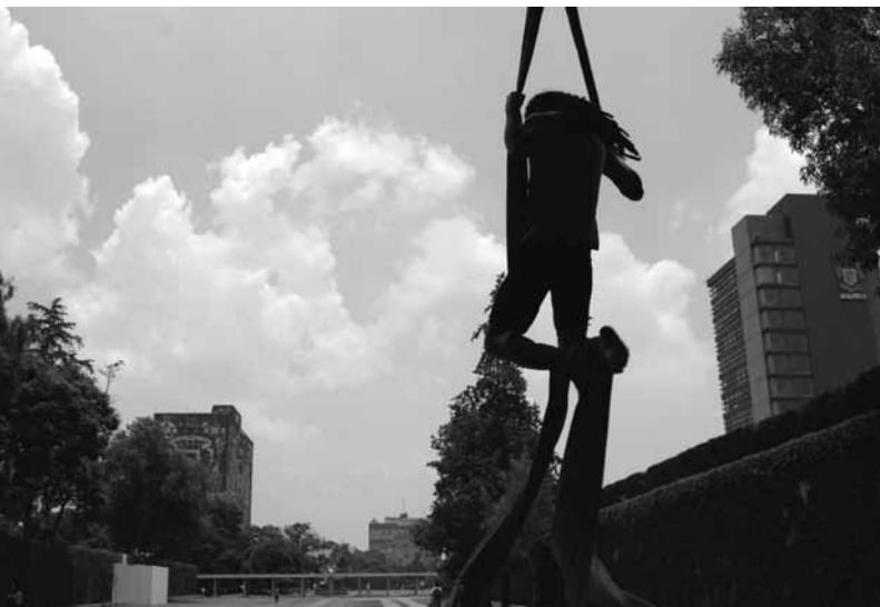
Acróbata a un costado de Rectoría