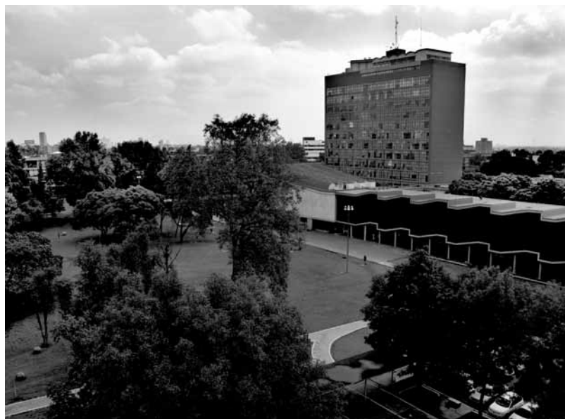
Vista de Las Islas frente al edificio de Posgrado

La condición heterogénea del espacio de Las Islas ha permitido que los usuarios puedan variar su uso y transformarlo de acuerdo a la temporalidad. Los sitios sin vegetación son generalmente utilizados para prácticas deportivas, mientras que los arbolados para descanso. En circunstancias eventuales los mismos espacios pueden servir para reuniones sociales o manifestaciones masivas. El espacio abierto reduce las fronteras entre lo público y lo privado, relaja a los usuarios y tolera comportamientos rechazados en otros lugares, lo cual contribuye al hecho de considerar CU como sitio de excepción de la ciudad con reglas de convivencia aceptadas por la mayoría y un sistema de vigilancia propio. Las actividades dentro de Las Islas son modificadas por los modelos energéticos existentes,