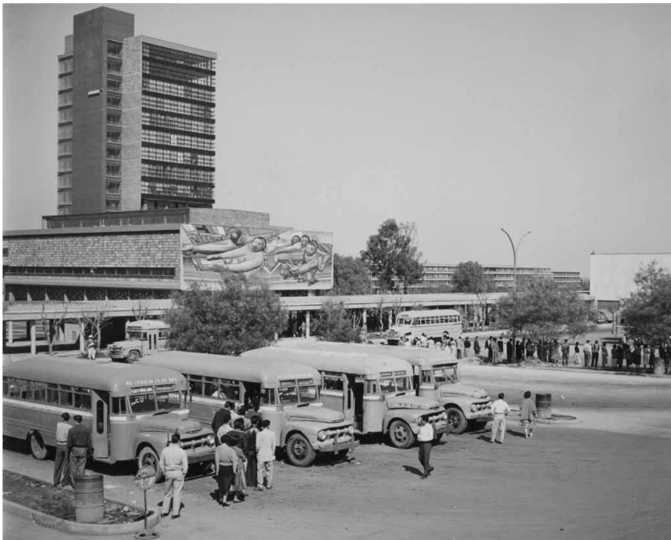
El paradero de autobuses de CU en los años cincuenta IISUE/AHUNAM, Colección Universidad, vida cotidiana en CU, folio 4672