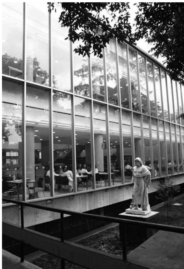
Biblioteca de la Facultad de Medicina

es decir, sus características espaciales permiten diferenciaciones de condiciones ambientales mismas que delimitan de forma interesante las actividades que ocurren allí. 15