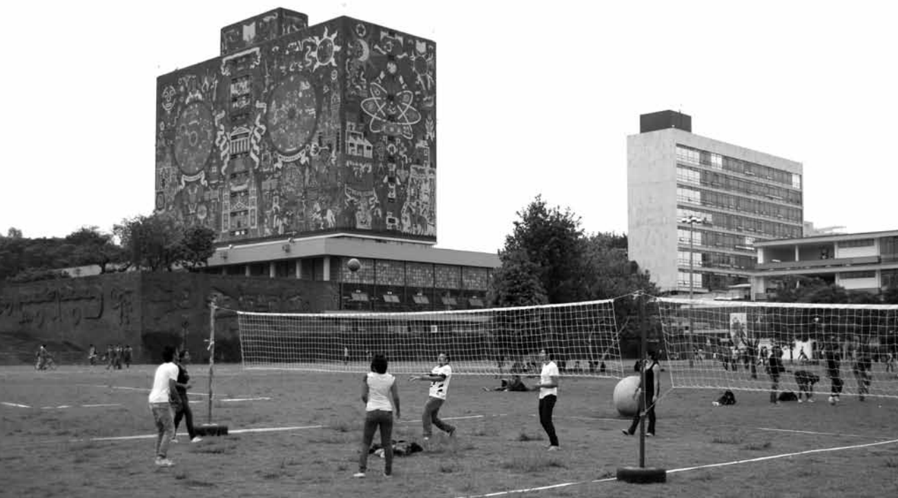
Actividades deportivas frente a la biblioteca.