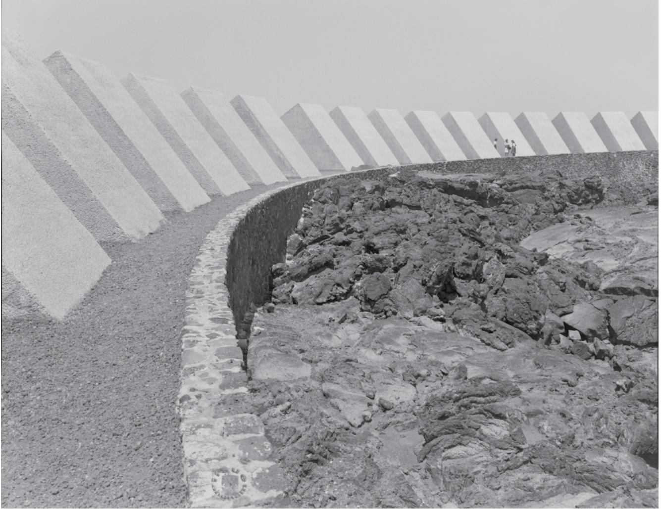
El Espacio Escultórico ISSUE/AHUNAM, Colección Armando Salas Portugal, folio 179

él. La economía también influye pues los encuestados recurren a servicios de alimentación informales debido al bajo costo de los mismos. En el campus central sólo existen cafeterías en las facultades de Filosofía y Letras, Arquitectura, Medicina y Odontología, la más recurrida por los estudiantes es la de Arquitectura, pues los encuestados manifiestan que la comida es buena y el espacio es más amable, mientras que el resto de las cafeterías son reducidas, por lo que no suelen utilizarlas. Actualmente, se carece de una cafetería central que brinde un sitio común para todos los estudiantes. Algunos encuestados hablaron de la importancia del intercambio de ideas entre estudiantes de diversas facultades, el cual podría ocurrir si se contaran con espacios comunes como una cafetería central.