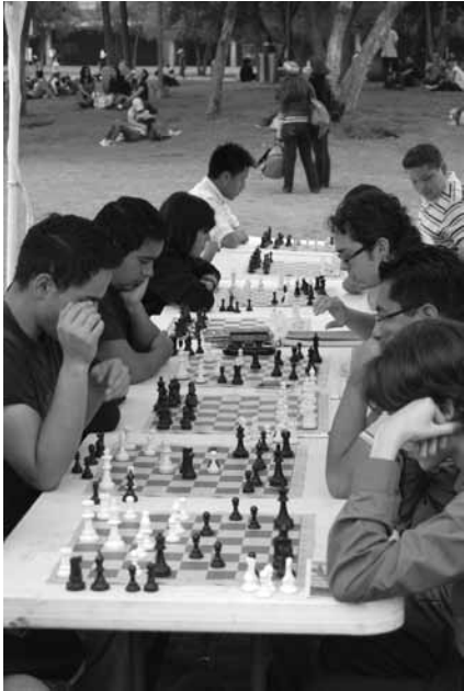
Torneo de ajedrez en Las Islas

Se definieron tres categorías de usuarios-estudiantes a partir del tipo de uso que le dan al campus y el tiempo que permanecen en él. De acuerdo con la carrera que cursan, los estudiantes utilizan de manera diferenciada los espacios del campus universitario, mientras que algunos requieren hacer uso intensivo de las instalaciones debido a sus obligaciones académicas, otros lo hacen por cuestiones recreativas y sociales. En resumen, se tienen las siguientes categorías: