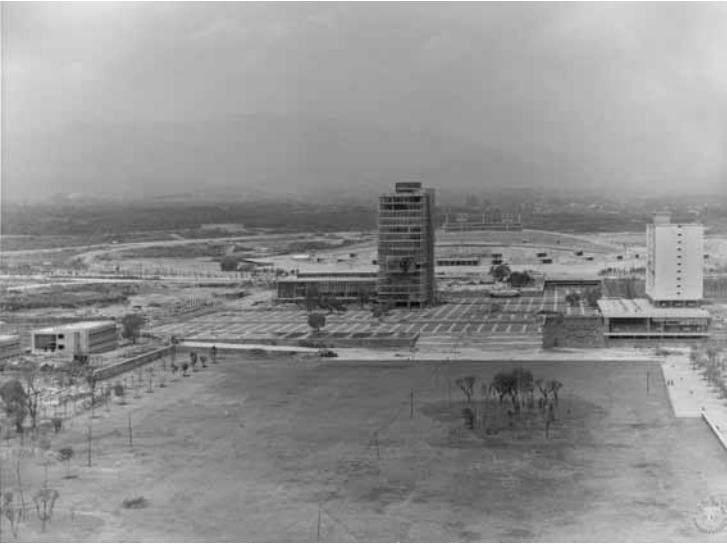
Vista de la explanada de Rectoría y "Las islas" en los tiempos de la inauguración de CU.

Otro factor determinante que influyó en el traslado de la Universidad a un nuevo campus fue la amenaza a la estabilidad institucional que representaba la presencia de los estudiantes en el centro de la ciudad al momento de las manifestaciones y protestas, encabezadas tradicionalmente por ellos.