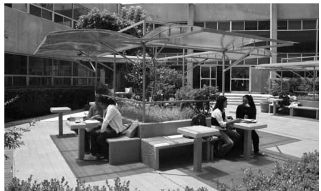
Patio central de la biblioteca de la FES Acatlán

En la práctica, el espacio público diseñado de esta manera difícilmente ha podido adaptarse a los cambios en la sociedad, lo que provoca situaciones de subutilización, sobre todo en los proyectos institucionales en donde las remodelaciones son difíciles de realizar por la permanente carencia de recursos del Estado. Un ejemplo recurrente del abandono y deterioro de los espacios abiertos modernos son los campos de juego ubicados en unidades habitacionales que se convierten en estacionamientos. El espacio público moderno, al resultar genérico y carente de escala humana, no cumplió los objetivos