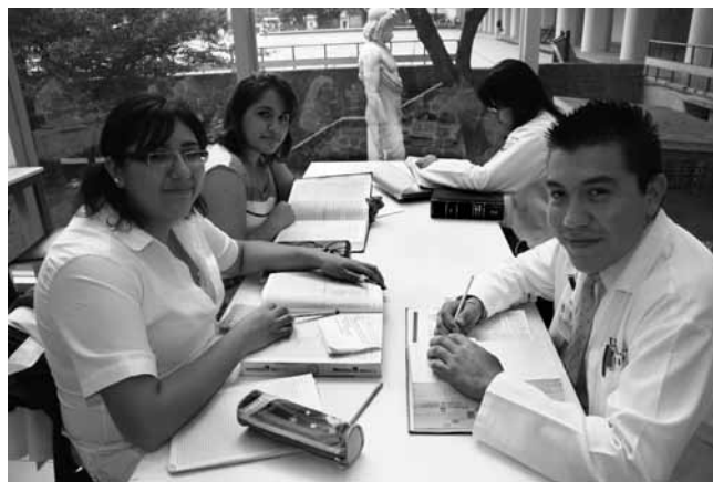
Estudiantes en la Facultad de Medicina