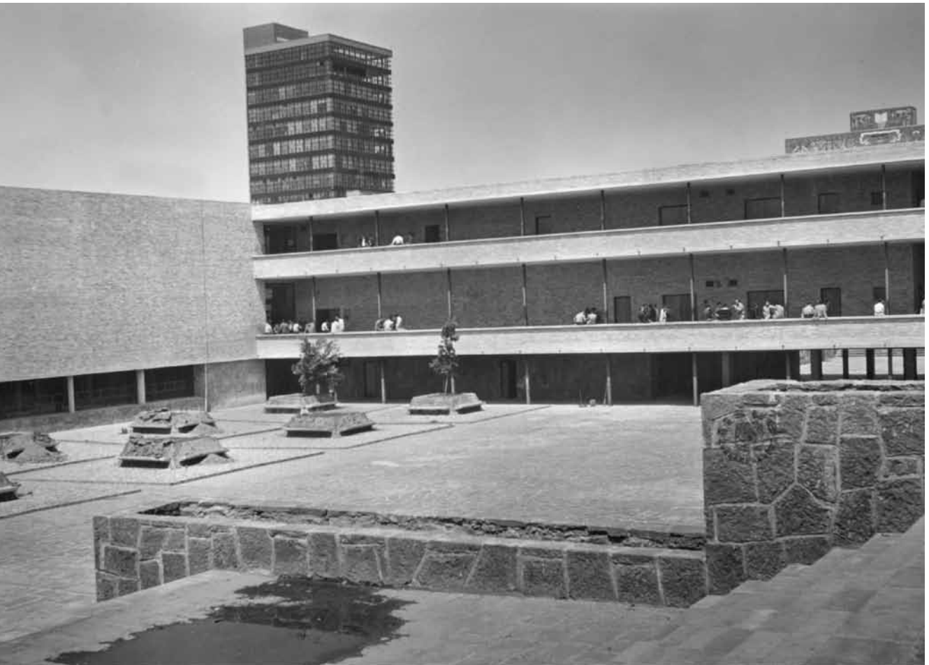
Patio de la Facultad de Arquitectura, 1954 IISUE/AHUNAM, Colección Universidad. Escuelas y Facultades, folio 4992

Durante la primera década de existencia (1952-1962) la conexión principal entre el campus y la ciudad era la avenida Insurgentes Sur, tanto para el transporte público como para el privado. Posteriormente, la avenida Universidad remodelada como tal en esos años, aseguraba la conexión con las colonias