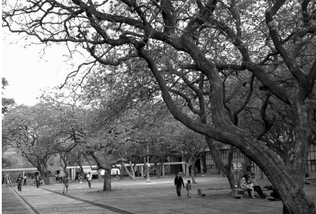
Patio de la Facultad de Economía en CU