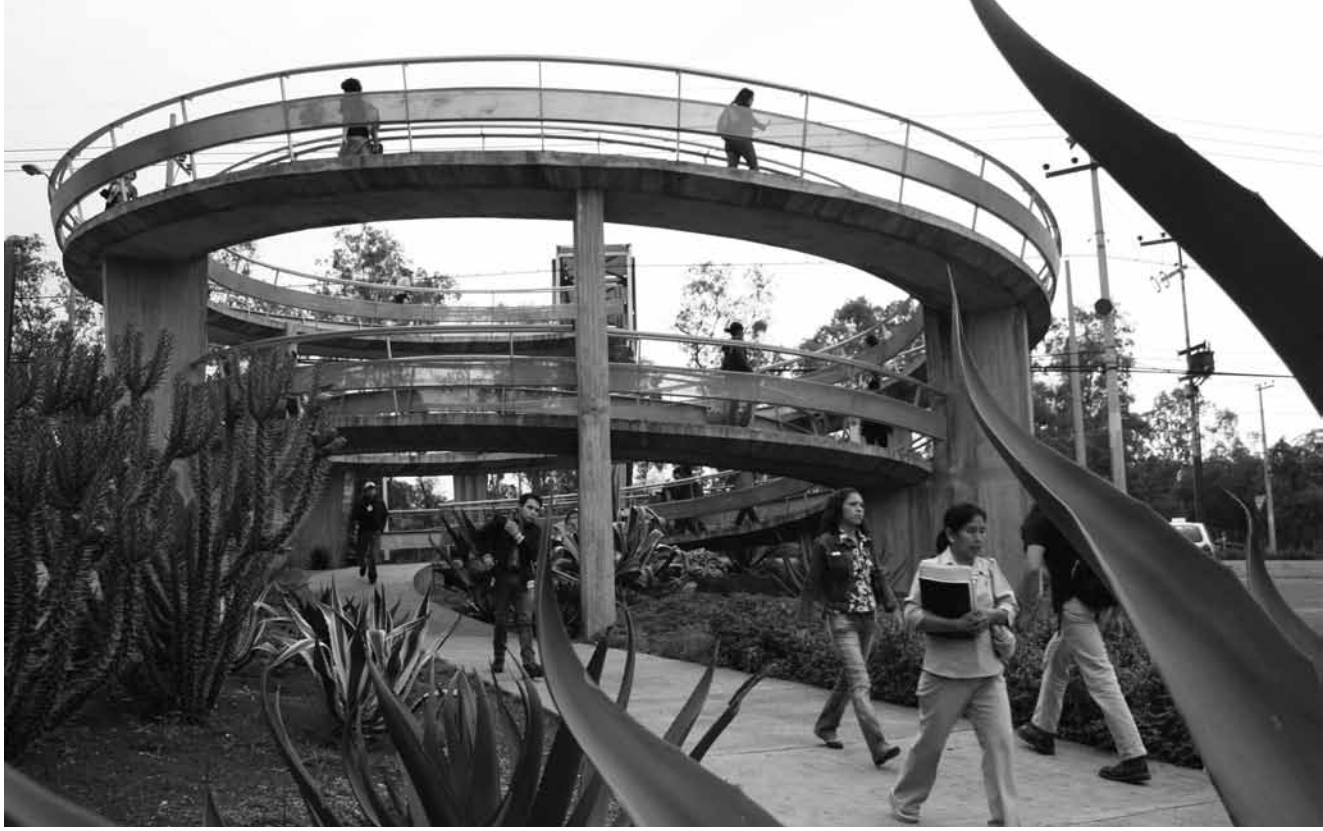
Acceso a la estación CU del Metrobús.