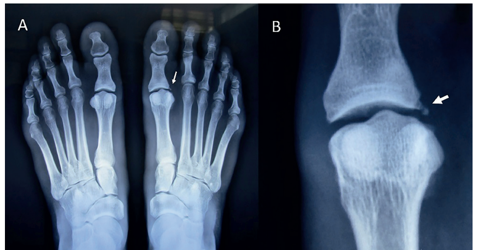
Figura 1. Radiografía simple de ambos pies con apoyo

De acuerdo con los estudios de imagen, ¿cuál sería su diagnóstico?, ver figura 1.