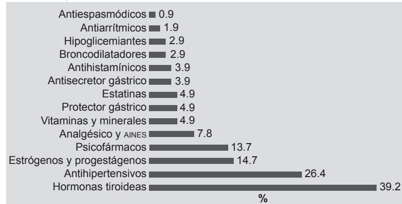
Figura 1. Medicamentos que consumen los docentes en forma prescrita

rias, 45.8% (33) rinitis, 27.8% (20) sinusitis, 22.2% (16) laringitis, 9.7% (7) desviación de tabique, 8.3% (6) asma y 1.4 (1) hipertrofia de cornetes; 98.7% (235) no había recibido algún tratamiento por cáncer o radioterapia en cabeza y cuello, y 1.3% (3) sí lo recibió (un docente yodo radiactivo y dos extracción quirúrgica de tumor tiroideo) (figuras 2 y 3).