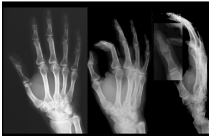
Fig. 1. Las vistas recomendadas para estudio de mano total y del carpo en especial A. B. Vista postero-anterior de mano de adulto. C, vista oblicua 30 grados. C. Vista lateral.

(Dado que en muchas instituciones se han incorporado equipos para mamografía, los fabricantes señalan cómo se puede aprovechar la excelente definición de estos aparatos para radiografías de manos; y recomiendan a los técnicos usar su destreza en extremo para no destruir el fino punto focal del tubo del mamógrafo que no aguanta mA, Kv y tiempos altos, o repetidos. Deben darse lapsos para enfriamiento del filamento).