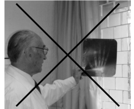
Fig. 2. ¡Así no! ver y, peor aún, tratar de estudiar radiografías con la luz de una ventana o cualquier foco conduce a errores sin cuenta.

Esa(s) imagen(es) se convierte(n) en nuestro “enfermo”, a quien se examina: se aconseja usar siempre un sistema de lectura de análisis de la imagen 1,2 ante una buena iluminación, en negatoscopio, aunque tenga el reporte del radiólogo -y con más razón si no lo tiene-; no como en la Fig. 2. Primero hay que barrer en orden con los ojos toda la imagen y continuar con cada estructura anatómica, sin saltar de una a otra hasta haber terminado; el análisis visual permitirá reconocer si la región es normal o patológica. Se debe contar con imágenes normales para comparación (ilustradas en Fig. 1 A, B) y sobre todo para el carpo, detallada la región en la Fig. 3 A, B, C y en la Fig. 5 en detalle para la mano derecha en PA.