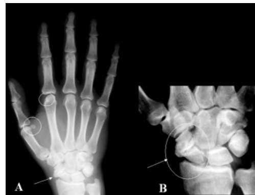
Fig. 6 A. Mano derecha en PA, adulto. Hay patología en el escafoides. Detalle: B. pérdida de su continuidad: fractura en tres fragmentos; existen signos de "absorción de hueso" en los márgenes de los fragmentos y "esclerosis" significan "fractura antigua", inadvertida o insuficientemente inmovilizada que ha dejado pseudoartrosis y un carpo doloroso.