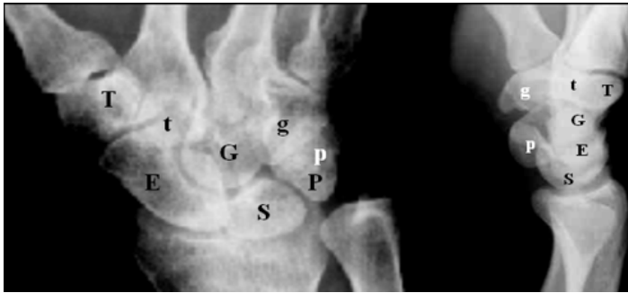
Fig. 3 A. Adulto. Carpo en la vista dorso-palmar (PA) se representan con letras, la primera hilera: escafoides, semilunar, piramidal, piriforme (el más pequeño) (ESPP "es pepe"- en nemotecnia). La segunda hilera (distal): trapecio, trapezoide, hueso grande, hueso ganchudo (T.t.G.g. Tete-gegé —en nemotecnia), entre los cuales los "espacios articulares" imagen del cartilago de revestimiento de la superficie articular) distinguen los contornos óseos parcialmente superpuestos en el carpo del adulto; y más difíciles de identificar en B. vista lateral, pero que para escafoides y semilunar la vista oblicua.