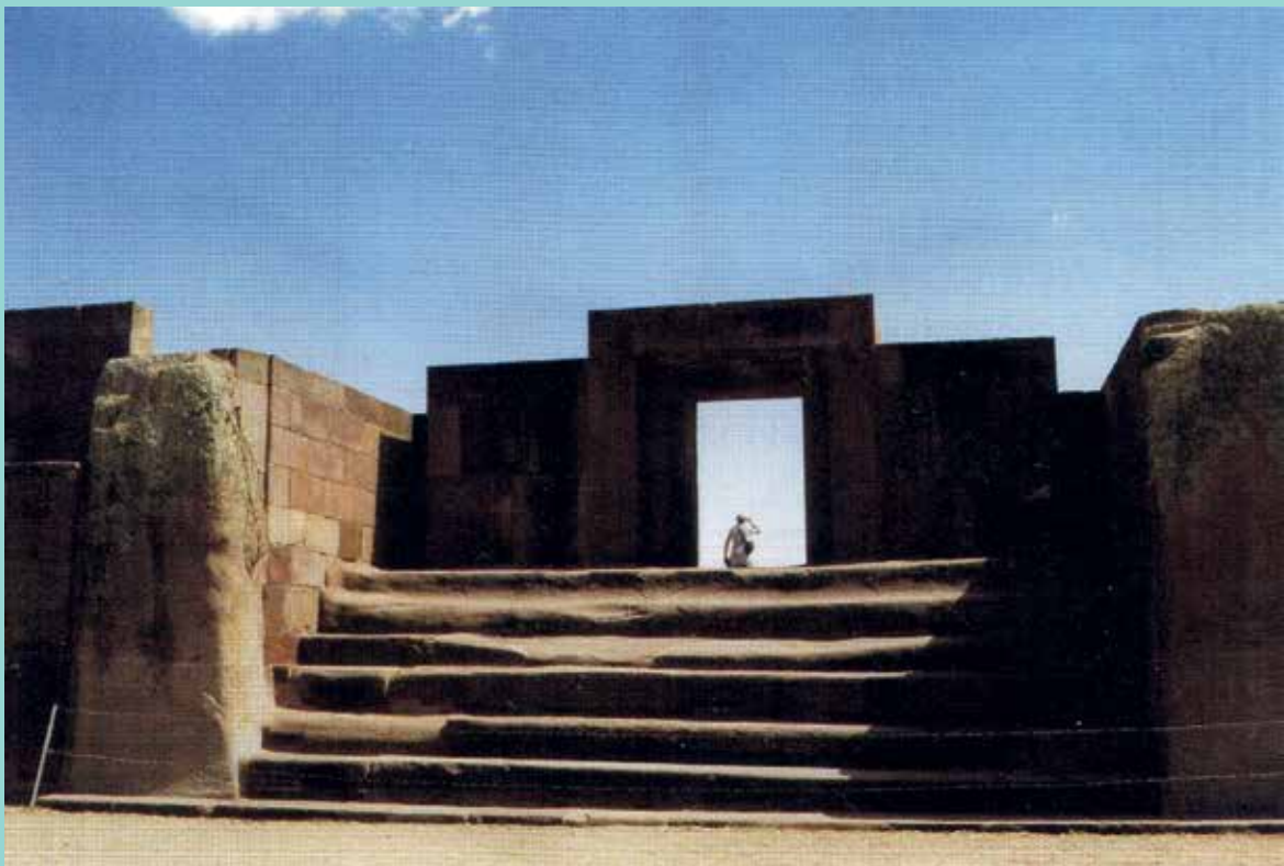
Tiwanaku, la gran capital del estado del mismo nombre