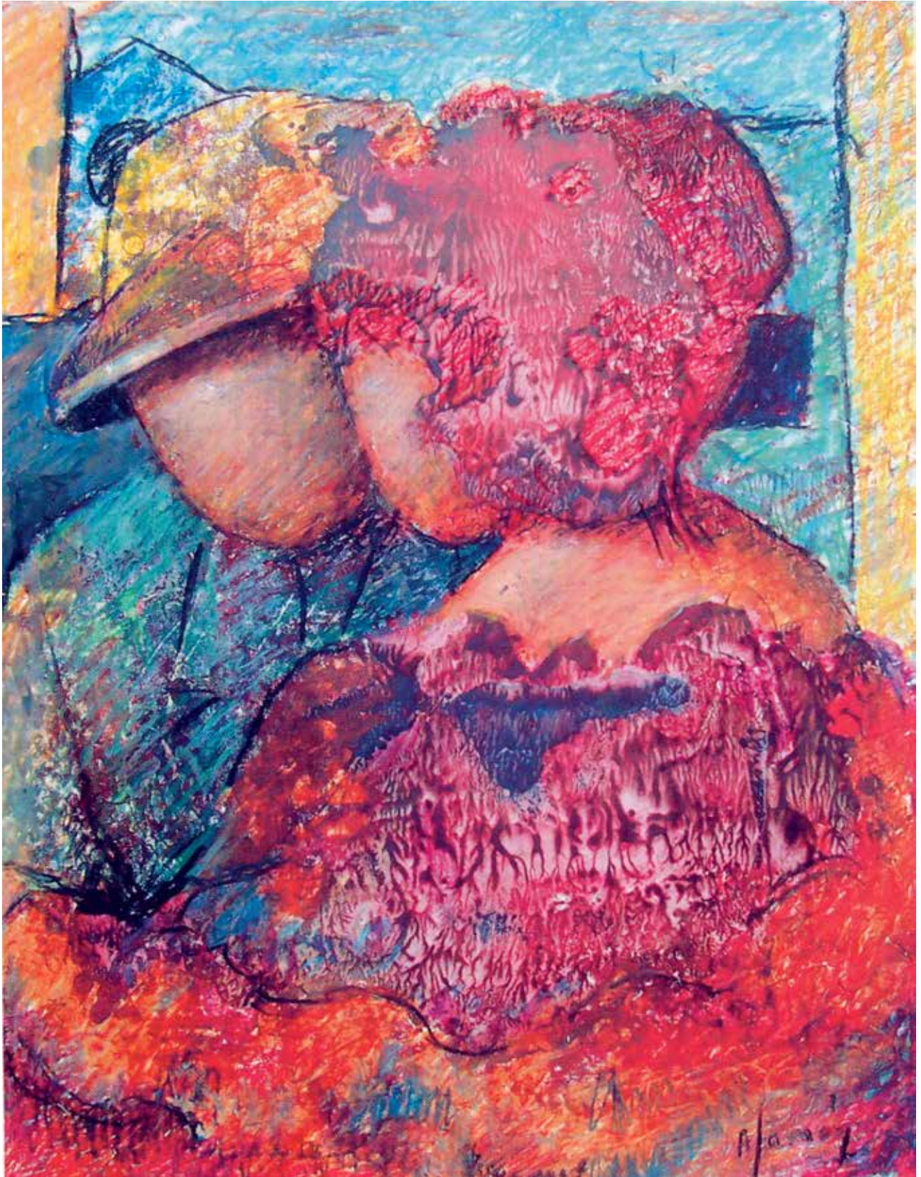
Ellos también. (Óleo pastel (34.5 x 49 cm.)