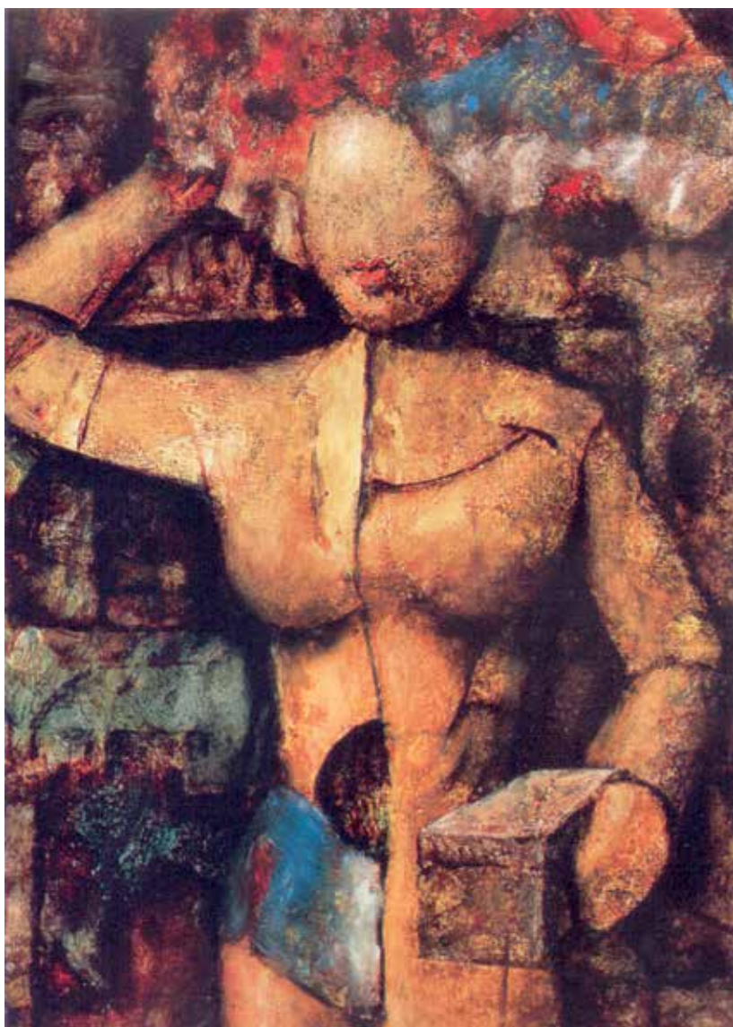
Pandora. Óleo sobre mdf (35 x 46 cm.)

humano como aporte a las nuevas generaciones. Pero como, a mi entender, el arte tiene como nutriente fundamental lo vivencial, nadie puede aportar un contenido trascendental a su obra si no es como fruto de su propia experiencia; es ella la que, una vez pasada por el filtro de nuestra inteligencia, se transforma en algo tan simple y necesario como la sensibilidad, un producto que no se adquiere en farmacias o supermercados. 🇺🇷