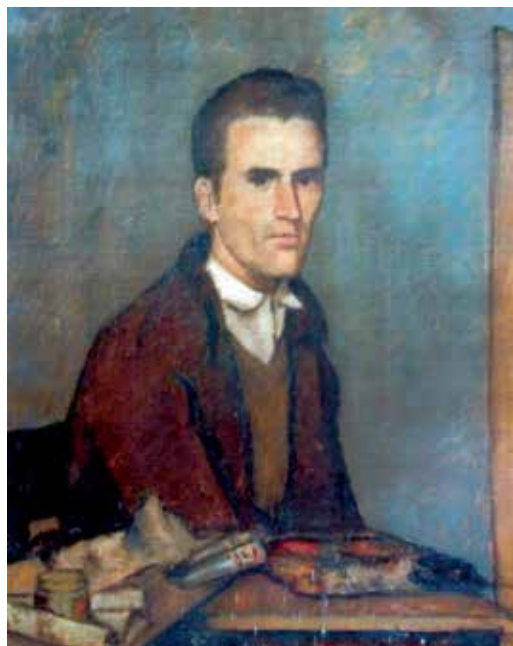
Autorretrato. Óleo (50 x 70 cm.)