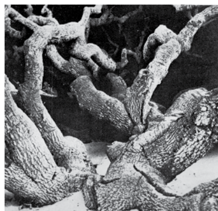
Ramas de árbol

Edward Weston (1886-1958). Fotógrafo estadounidense de gran prestigio. En 1923 viajó a México, en donde permaneció hasta 1926, viviendo con la célebre fotógrafa italiana Tina Modotti, cuyas inclinaciones políticas y sociales le influyeron notoriamente. Los tres grandes de la pintura mural mexicana: José Clemente Orozco, Diego Rivera y David Alfaro Siqueiros, fueron excelentes amigos y admiradores suyos.