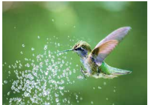
Hummingbird shower. Elena Illescas