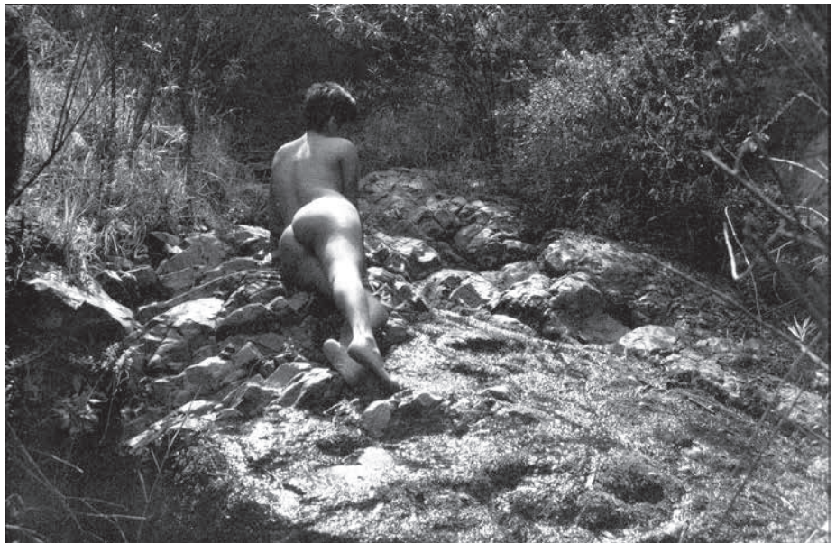
Corre el río