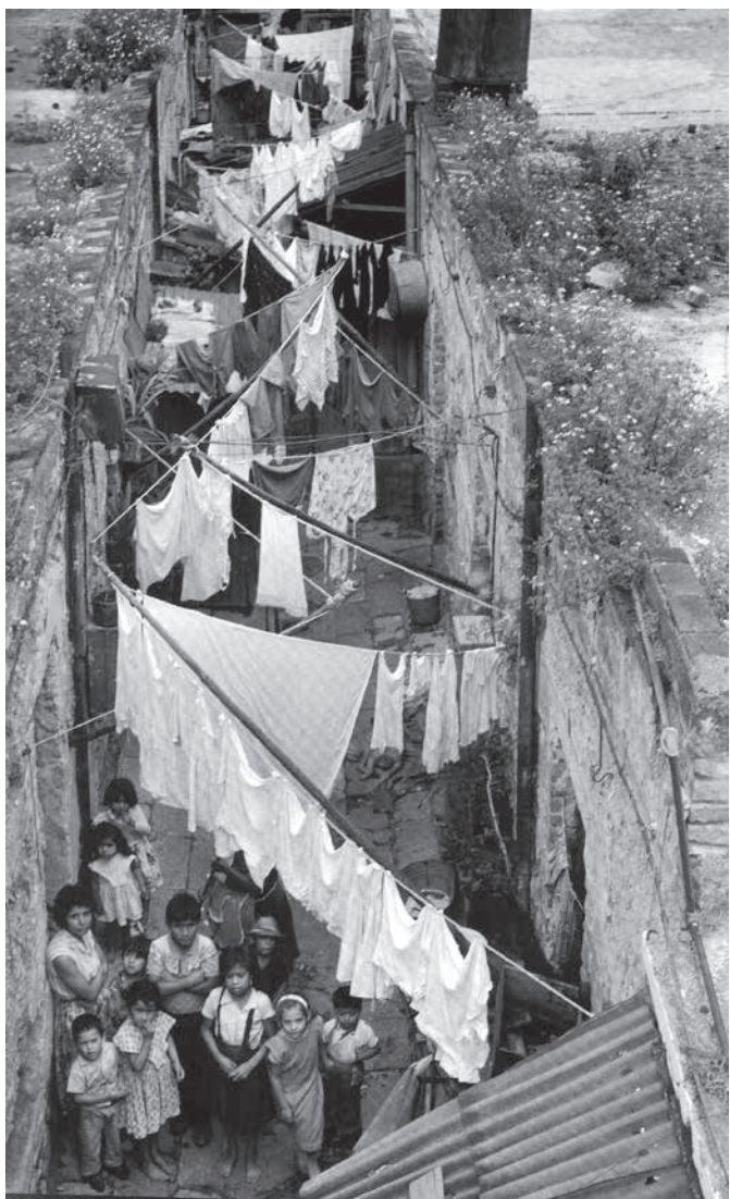
La Casa Blanca . Ciudad de México, ca. 1965. Vecindad que habitó la familia cuya vida documentó el antropólogo Oscar Lewis en Los hijos de Sánchez