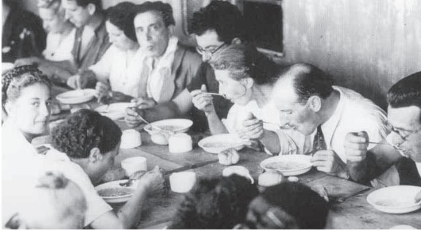
Exiliados españoles en su tránsito hacia México