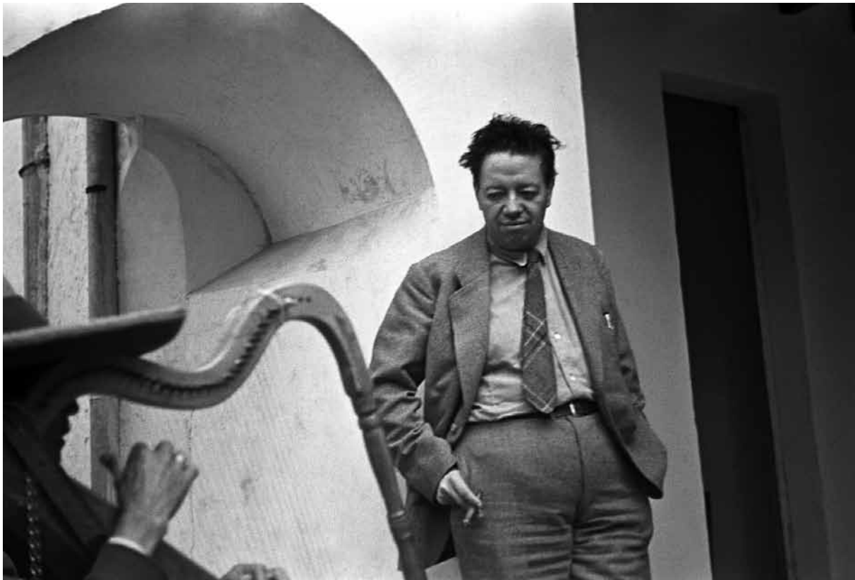
Diego Rivera, ca. 1941

lo que viajó por toda América Latina. En su periplo consiguió miles de imágenes, tanto de la heterogénea población y los paisajes del continente, como también de la diversidad de tradiciones y de las idiosincrasias comunes.