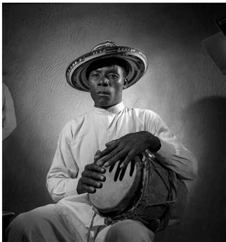
Vallenatos, ca. 1955