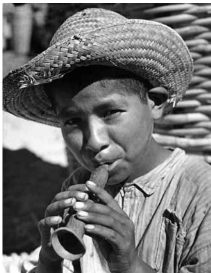
Niño con Chirimía, 1941