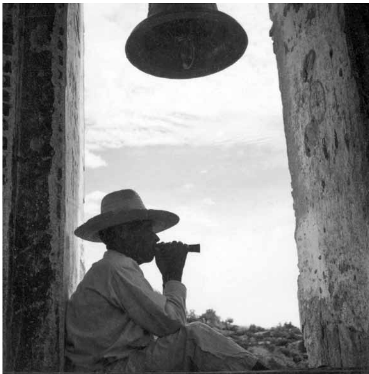
Indígena con flauta, ca. 1943