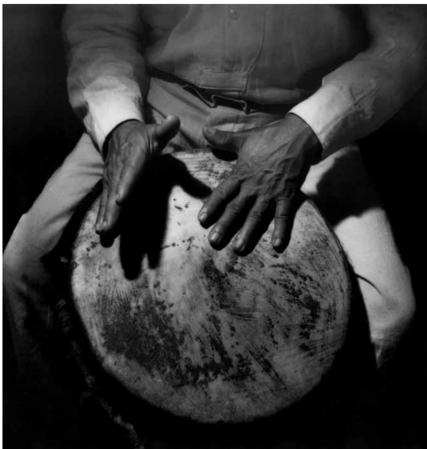
Palenquero, ca. 1955