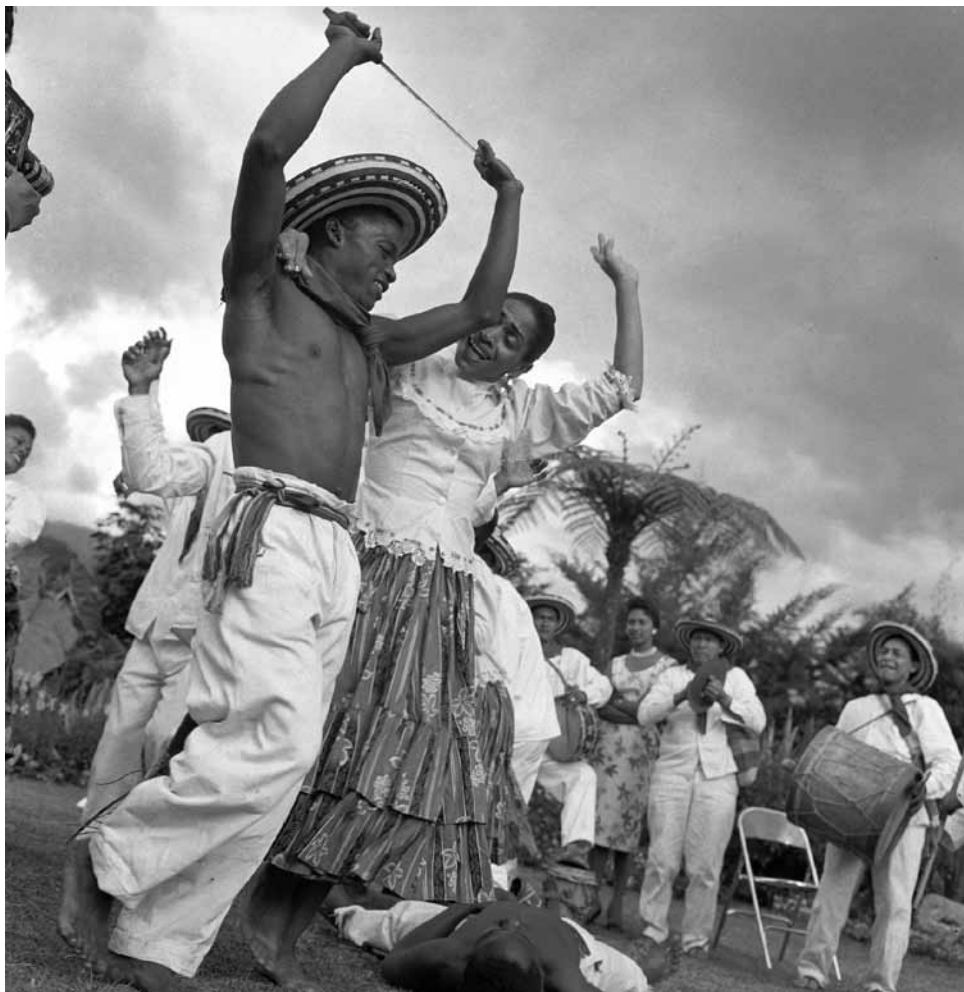
Cumbia, ca. 1955