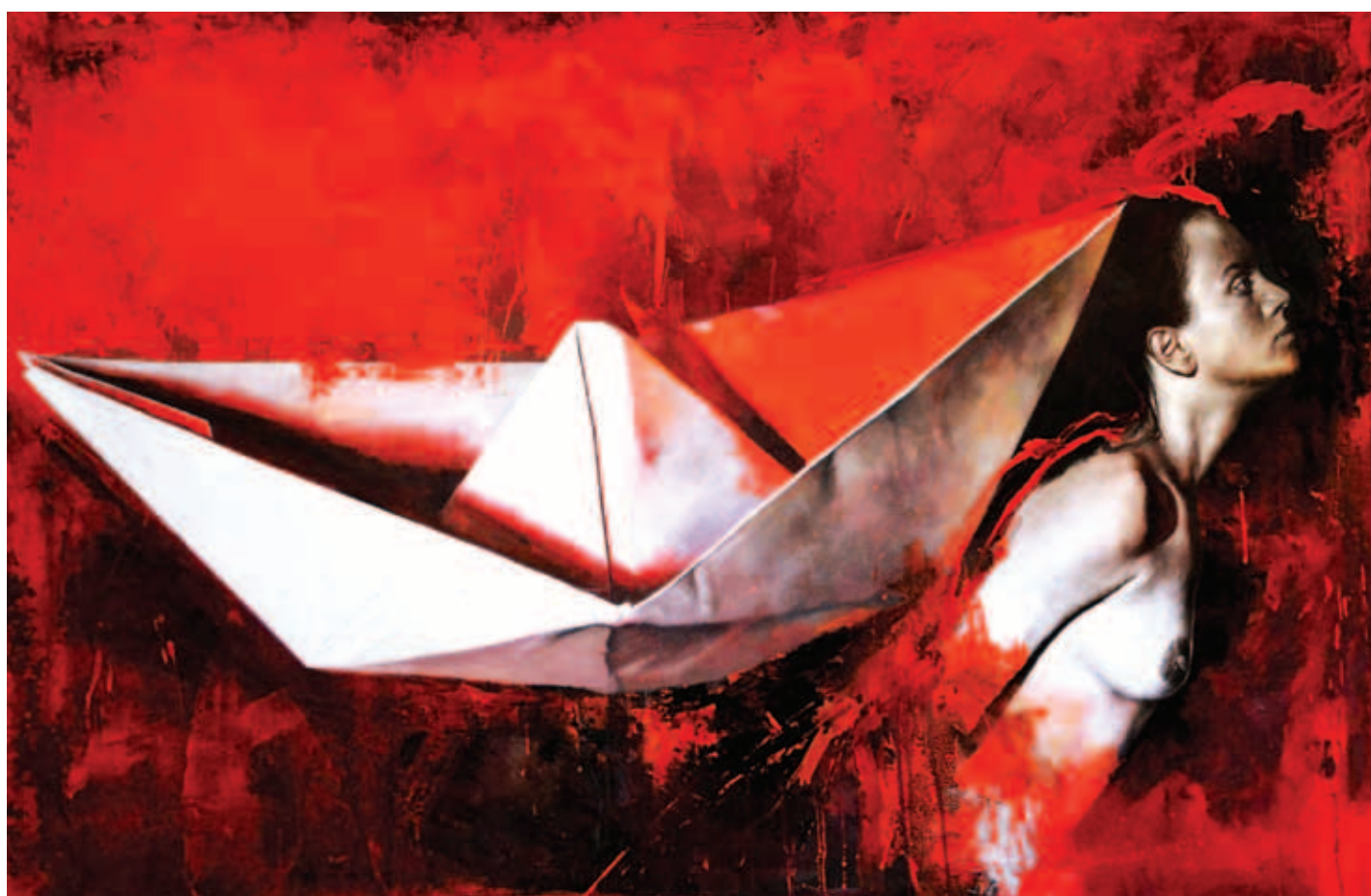
Calavera de papel. Óleo lienzo