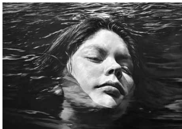
Travesía. Óleo lienzo

En otro conjunto de pinturas se combina la rigurosidad de la figura humana con la abstracción que descompone los cuerpos, de ellos emana una explosión de manchas, explosiones de agua que toman fuerza hacia el exterior a manera de intervención que rompe la figura. Entre todos esos cuerpos, los hay fuertes y saludables, flácidos y viejos,