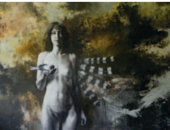
Reencarnación. Óleo lienzo