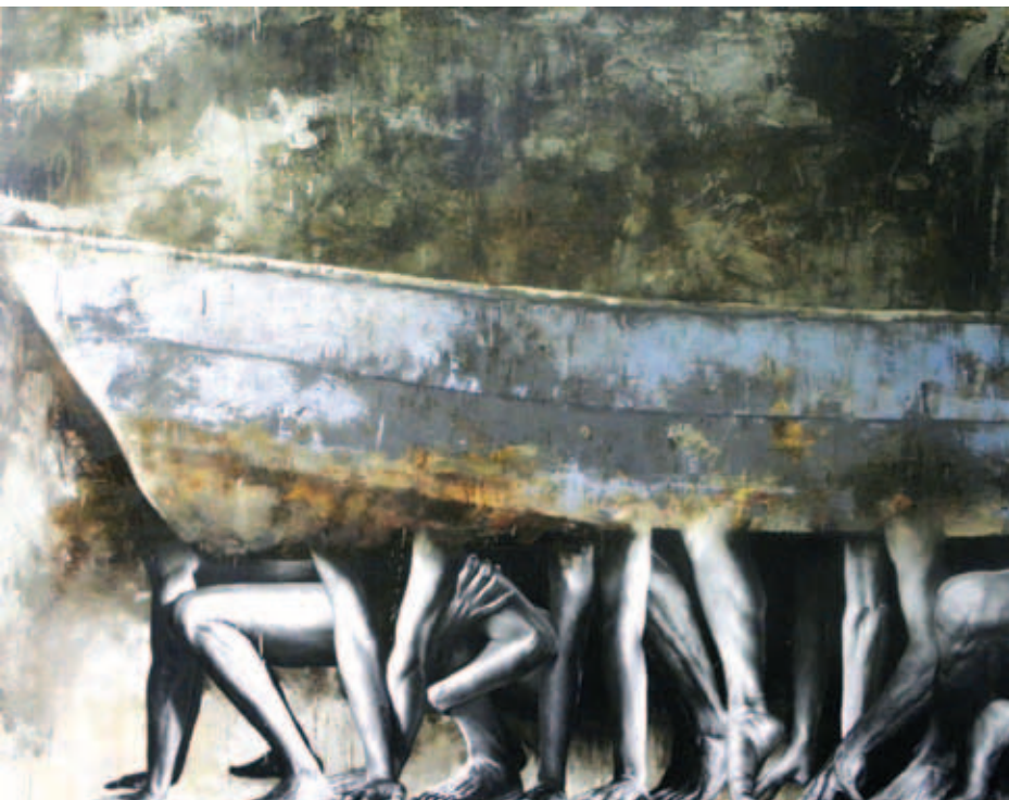
Éxodo. Óleo lienzo