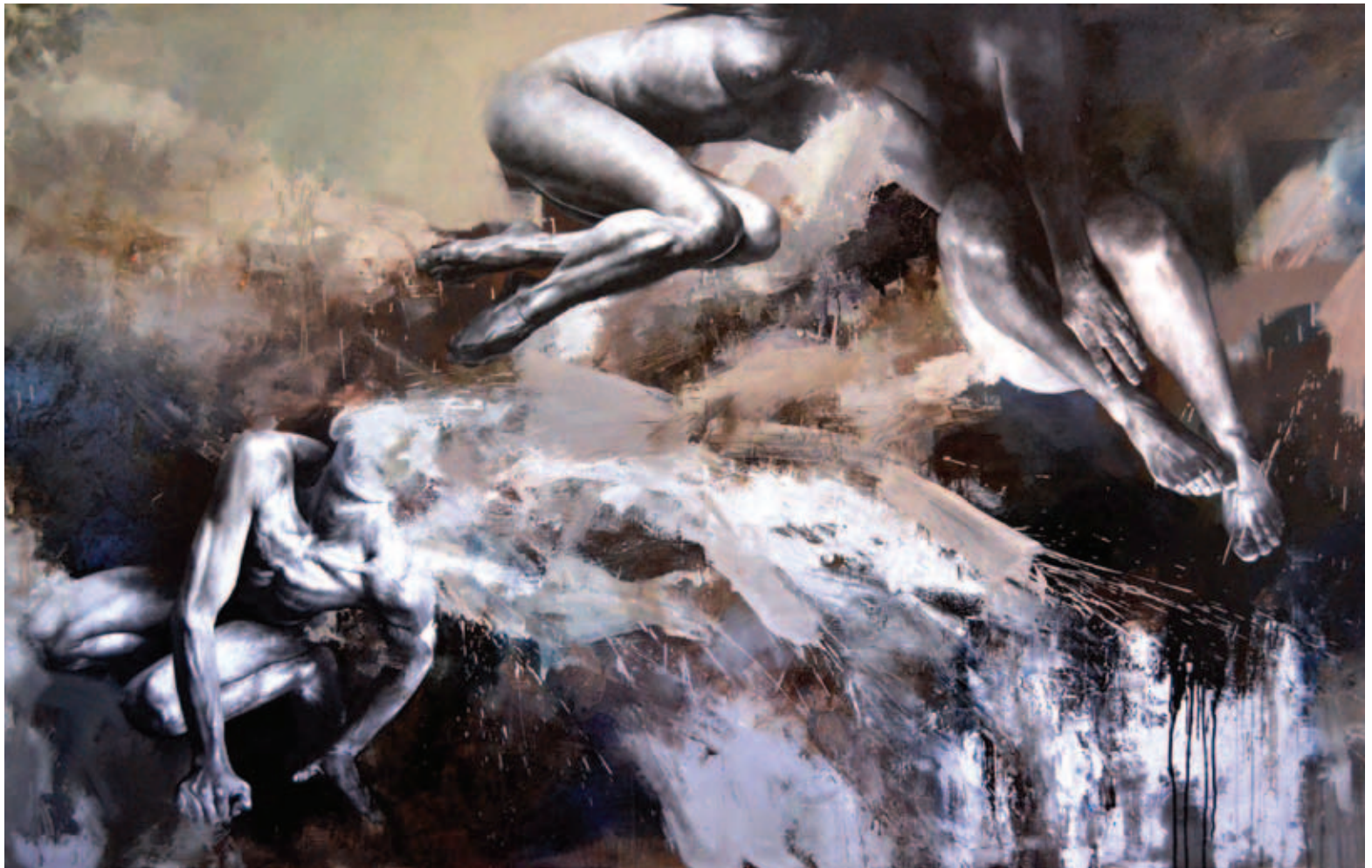
Composición. Óleo lienzo