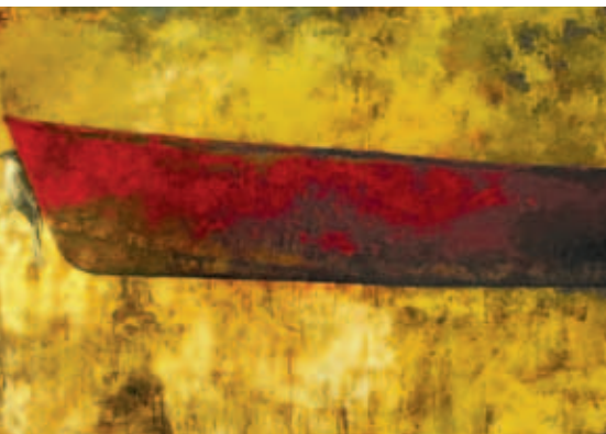
Travesía en el guatini. Óleo lienzo