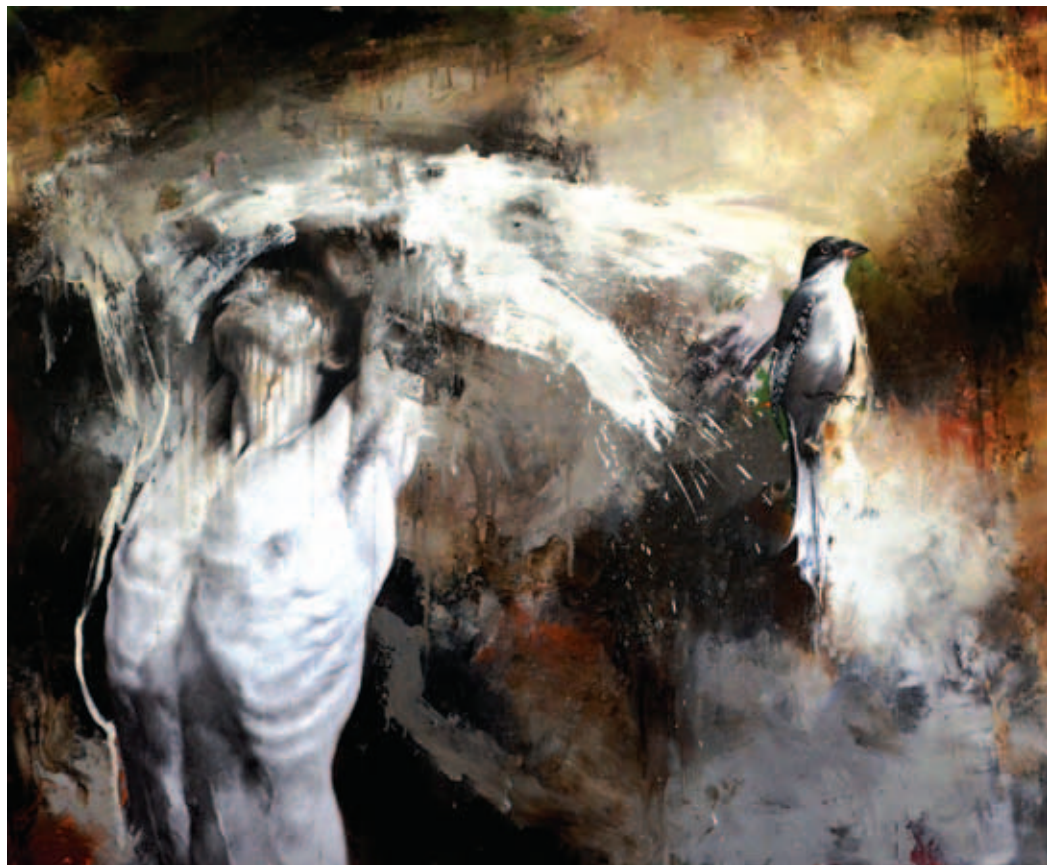
Conexión. Óleo lienzo